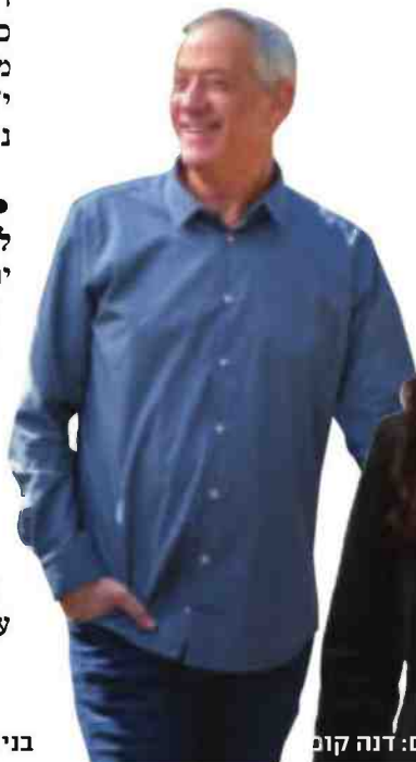
בני גנץ