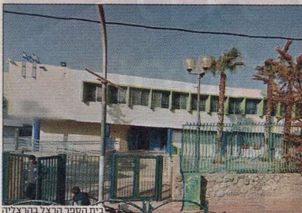
בית הספר הרצל בהרצליה