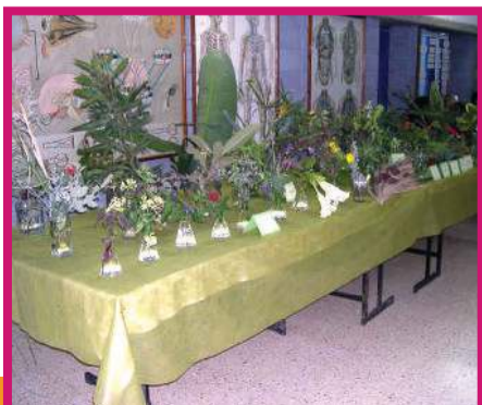
מגמת ביולוגיה מציגה

אם אתם ביל גייטס הבא, זו המגמה בשבילכם! המגמה מכשירה את בוגריה ליישום מערכות ממוחשבות בעולם ההייטק, ומלמדת כל מיני חידושים טכנולוגיים. מי יודע, אולי יום אחד תמצאו מחדש את "מייקרוסופט"? שלמה פל, י"2: "אני אוהב מחשבים כי זה הכי קל חוץ מכימיה. אבל רק עכשיו הצטרפתי, אז אני לא יודע. היא תורמת לי, אני לומד מקצוע לבגרות ולחיים. המגמה סבבה. בהתחלה כשהתקשינו, למדנו דנו את החומר של שנה שעברה, אבל זה היה מבאס, במיוחד שחצי מהתלמידים שלא הבינו פשוט מהמגמה. אייליה היא סבבה של מורה – אני מציע