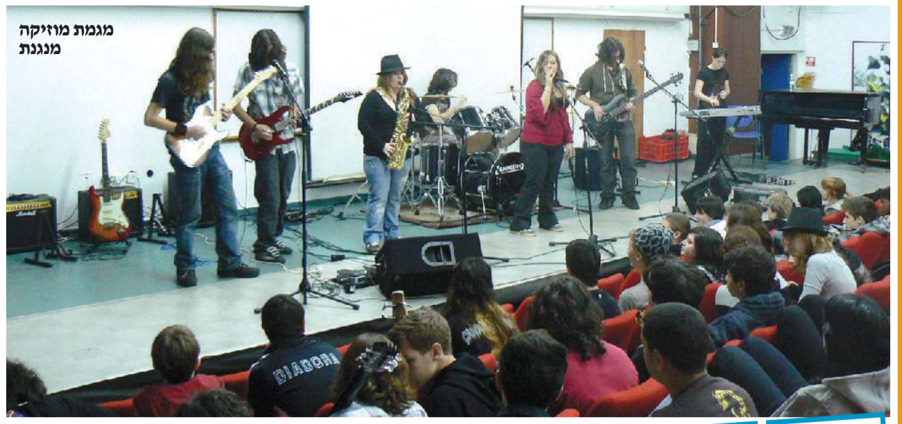
מגמת מוזיקה מנגנת

מגמות הן הדרך של בית הספר להעניק הרחבה בתחומי עניין שונים • אם המיוגון מבלבל אתכם, נעשה לכם קצת סדר • כתבת "ידיעות הכפר הירוק" יצאה לבדוק מה המגמה