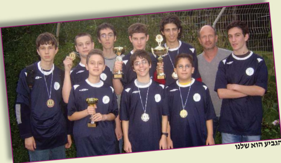
הגביע הוא שלנו

שלוש הנבחרות צברו ניקוד גבוה, זכו במדליות אישיות ועלו לגמר. נותר עוד מחזור אחד מכריע. בהצלחה!