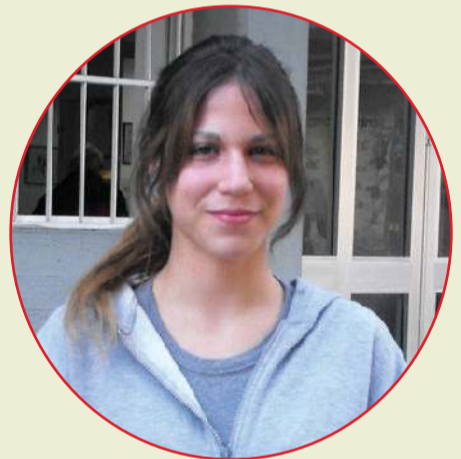
מאת איליה רץ ט' 4/ "ידיעות הכפר הירוק"

יש כל מיני אנשים מיוחדים. אנשים שיוודעים לנגן, אנשים שיוודעים לצייר, אנשים שיוודעים שפות רבות ואנשים שפשוט יודעים.