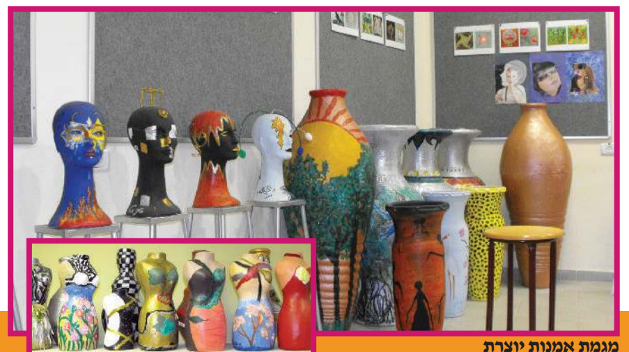
מגמת אמנות יוצרת