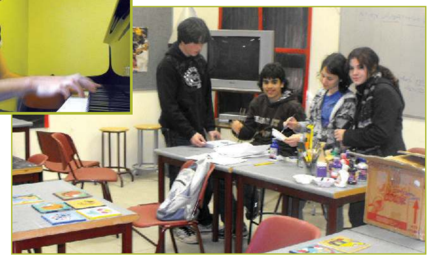
דרך יפה ומיוחדת להנצחה. פעילות בבית ריושקה

מנויות - ודווקא אצלנו. יוספה: "אחרי שאמא שלנו נפטרה, אבא שלי רצה להנציח אותה בדרך שתבטא את חיה וכישוריה. חשבנו שלהקים בית ספר לאמנויות יתאים לכך מאוד, משום שאמא דאגה תמיד לילדים, והאמנות תפסה חלק ניכר מחייה. גם אני יודעת כמה יכו לה תרפיה באמנות לעזור לאנשים בכל הגילים, וב' עיקר לצעירים". ולמה דווקא כאן? "בחרנו בכפר הירוק, כי יש בו הפנימייה הגדולה בארץ, ויש בה הרבה עו-לים חדשים, וילדים שאין להם גישה לכלים. בעלי, כבוגר הכפר הירוק, מאוד המליץ על כך". וחדר המחשבים? "חשבנו שהמחשבים יכולים להוות חיבור להווה ולחיי היום יום. חוץ מזה, נראה לנו שהכפר היה זקוק לזה. "לפני שאבא שלי נפטר הוא ראה את הב-נייה מסתיימת, ושימח אותו מאוד לראות כל כך הרבה ילדים מוכשרים נהנים מבית ריושקה".