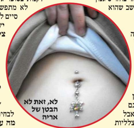
לא, זאת לא הבטן של אריה

"וכל זה מחזיר אותי למושג 'קוד לבוש': מה נכון לבוא איתו לבית הספר ומה לא. כמו שאת מצפה לראות את מורייד לבושים בהתאם, כך גם את צריכה לכבד את הכללים ולהתלבש לפיהם". לא לבשת בגדים מיוחדים בילדותך? "גם אני הייתי מסתובב עם כל מיני אביזרים שדומים לניטים ולמה שאתם לובשים, וכשאני מסתכל בתמונות מהילדות שלי, אני לא מצליח להבין למה לבשתי את כל זה. "בני הנוער של היום שמרנים. אפשר למיין אותם לקבוצות, כי כל אחד בוחר סיגנון קיים, למרות שהוא חושב שהוא סיגנון בפני עצמו". קעקועים יש לך? "לא. אני בטוח שיש כמה מורים שיש להם, אבל שימי לב, שהם מסתירים אותם היטב". למה אסור איפור? "כל עוד זה לא מור, גזם, ואני מתכוון שבתור מורחות טיפה בעין עם העיפרון, זה בסדר. גם טיפת מייקאפ זה נסבל. אבל למה ילדה בת 12 צריכה צלליות ואודם כשהיא באה לבית הספר? עדיף המראה הטבעי.