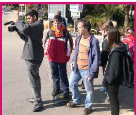
מגמת קולנוע מצלמת