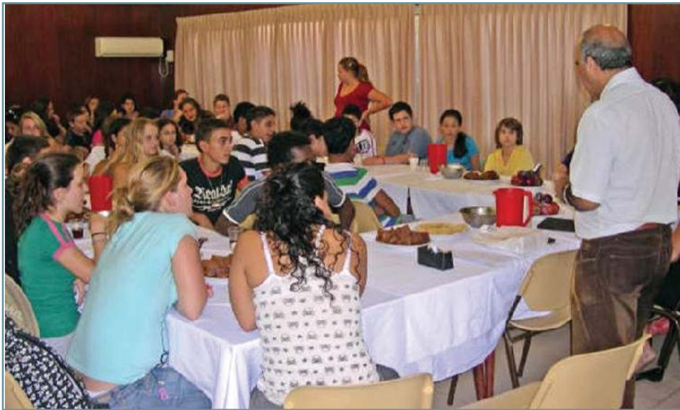
יש לנו המון רעיונות. מועצת התלמידים עם מנהל הכפר

אפשר לפנות אלינו בכל עת עם רעיונות לשיפור ולקידום, והמועצה תעשה כל שביכולתה כדי לקדם אותם.