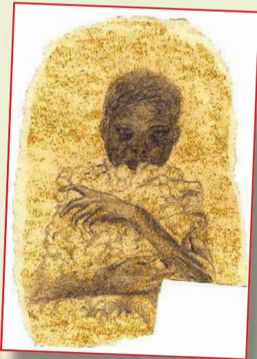
פירות מכחולה של אבלין

"בגיל ההתבגרות הייתי מאוד אנושי, מנותקת מעצמי, ולא הקשבתי לאף אחד, ובמיוחד לא לאמא. כעסתי עליה והיינו במעין מאבק כוחות, אבל בשלב מסויים הגעתי למסקנה שאני אוהבת אותה ושהיא לצידי, שהיא עוזרת לי ואני לומר מרת ממנה".