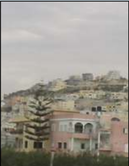
מראות מרמת הגולן, תלמידים ברמת הגולן, ודורון סטוב