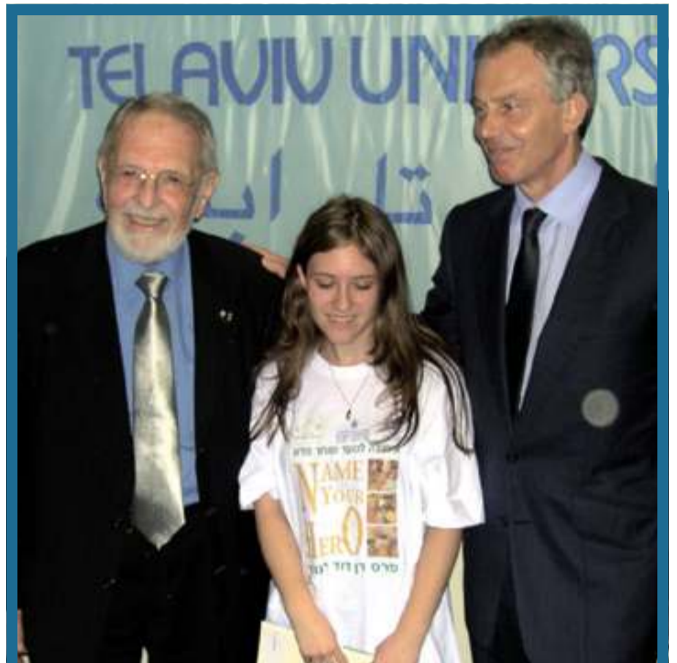
כמנהיג אל מנהיגים עמ' 2