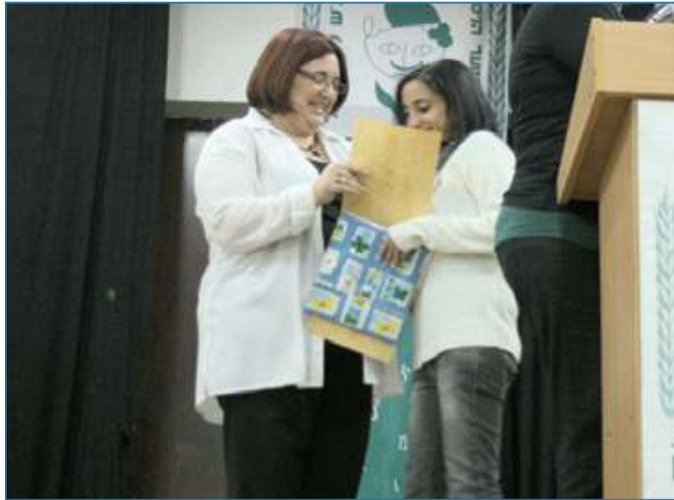
שהם שמש שרביט, הזוכה בשני המקומות הראשונים