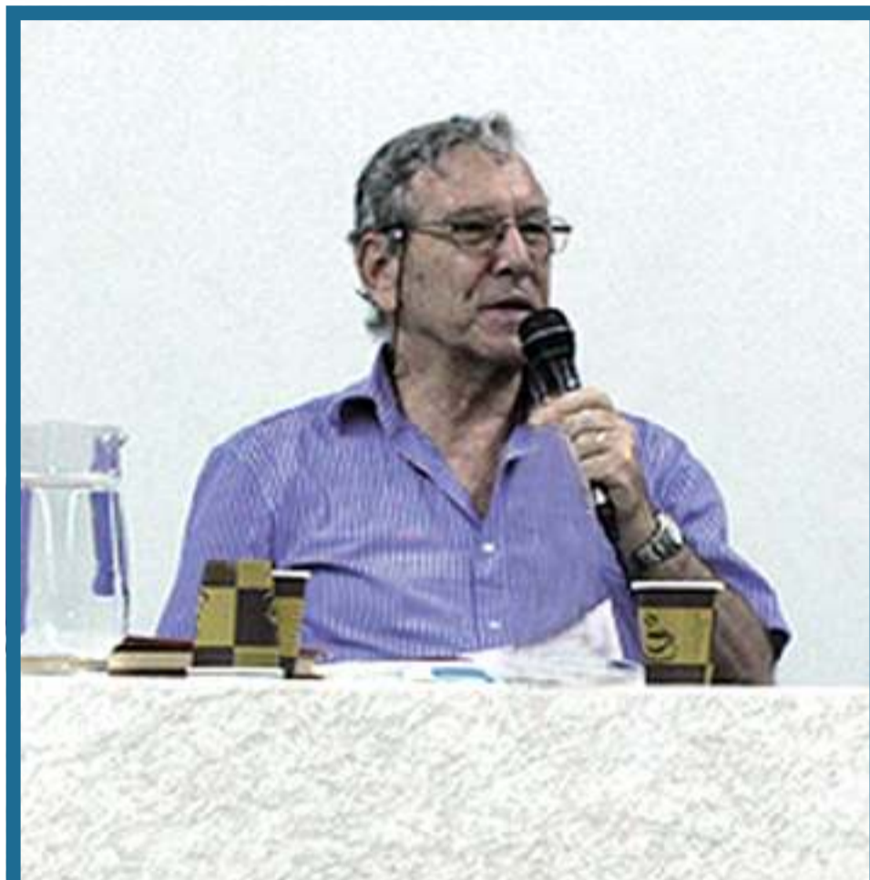
נולד לכתוב עמ' 3