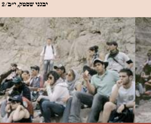
מסלולים מהנים, אבל הכי כיף בערבים

ביום הראשון היינו בקניון שחרות, ביום השני בהר צפחות, וביום השלישי בקניון הארום. שלוש המסלולים היו מעניינים ומהנים, אבל הכי כיף היה כמובן בערבים. בערב הראשון רקדנו במסיבת דיסקו על ספינה שטה. בערב השני עשינו על האש בחוף וילג' ושוב רקדנו. אחר כך גם נתנו לנו זמן חופשי להסתובב באילת, לערוך קניות בקניון, ללכת בטיילת ולדרחוק בים.