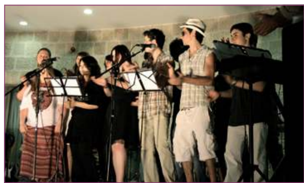
"רוצים להיות מדעני טילים". נראה לכם?