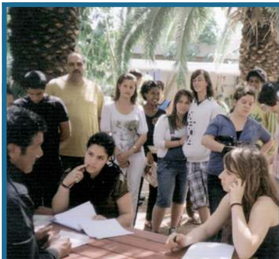
בזכות תוכנית ה'10 עמ' 9