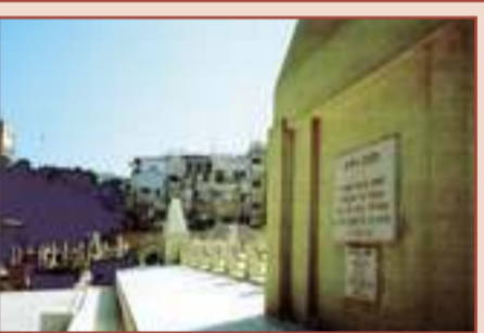
סיפורים ציוריים וציורים שמספרים. נווה צדק