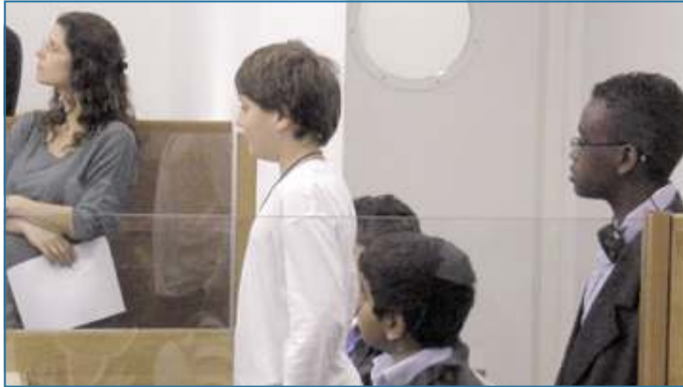
הדובדבן שבקצפת: משפט מבוסס בבית המשפט המחוזי במתח תקווה

וגם על דוכן השופטים, מתחת לגלימות התובעים וליד שולחנה של הסניגוריה • למשך שעותיים הפכו תלמידי ז' / 1 לשחקנים הראשיים במשפט שסיכם שנה שלמה של לימודים