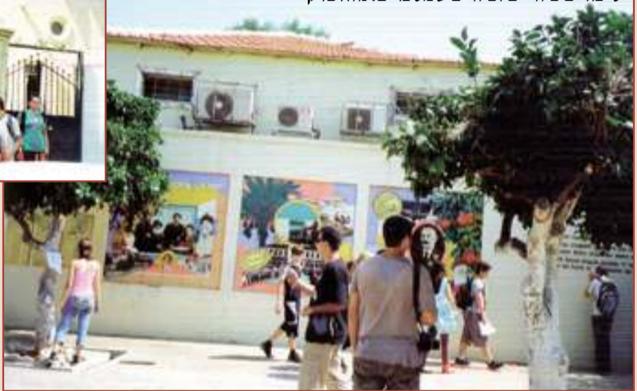
סיפורים ציוריים וציורים שמספרים. נווה צדק

כביכר המרכזית של נווה צדק יש ציורים יפים בהם מופיעות הרמויות החשובות אשר הקימו את השכונה. בית הספר לבנות שנמצא במקום, נבנה לפני שנים רבות, שור' חזר ושופץ ויופיו עשה עליי רושם רב. מחוץ לבית הספר יש באר