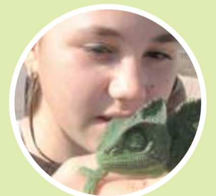
מאת אורי הרק, 2/ ידעות הכפר הירוק

ידעתם שיש המון זיקיות וצבים בכפר? • קבלו כתבה על הזוחלים הכפר-ירוקניקים הגאים • פלוס שבועה דברים שאין סיכוי שידעתם עליהם קודם!