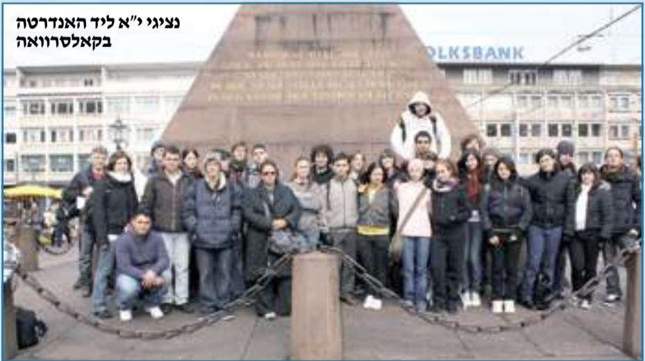
נציגי י"א ליד האנדרטה בקאלטרואה

חילופי הנוער בין ישראל לגרמניה נועדו ליצור קשרים חדשים בין שני העמים, למרות העבר הכואב • זה בדיוק מה שעשתה משלחת הכפר הירוק, ששילבה בין טקסי זיכרון לבילויים משותפים – וגילתה שרב הדומה על השונה • להכיר ולהזכיר