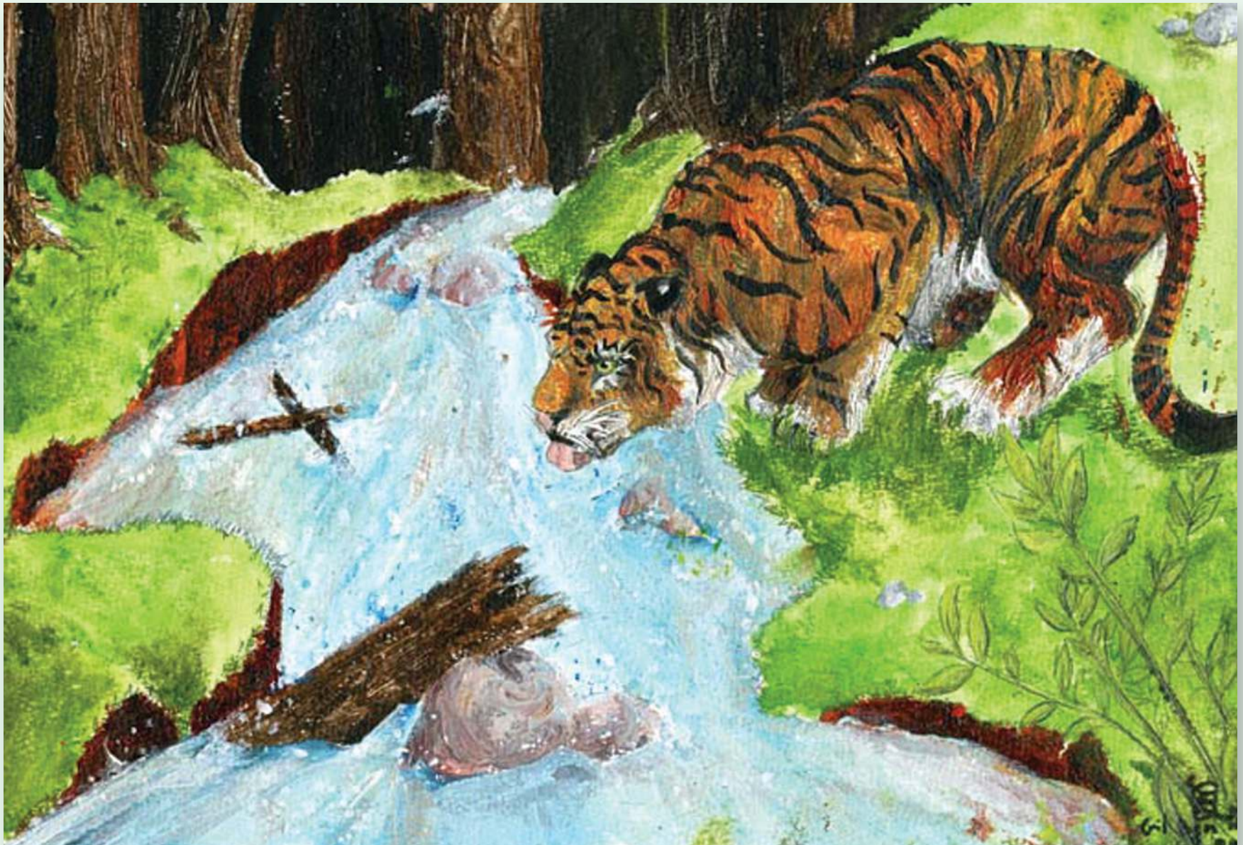
גיל בן נון