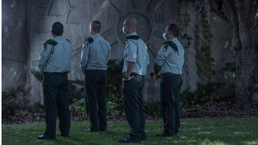
הקצינים שמובילים את תוכנית "מגשימים": מימין אל"מ ק, אל"מ ש, אל"מ י, אל"מ ע