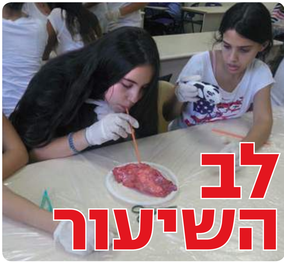
מצאנו את כל החלקים. לומדים ומעמיקים