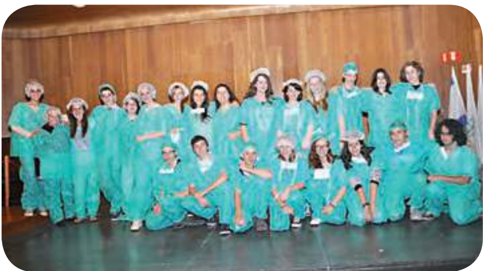
י' 3/ קדם רפואה בסיוור במאיר. שיתוף פעולה שתורם