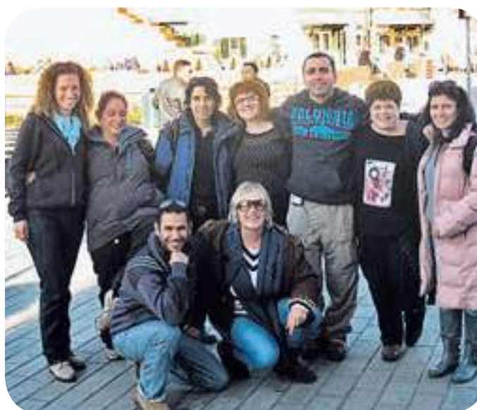
סגל המורים המלווים למשלחת לפולין