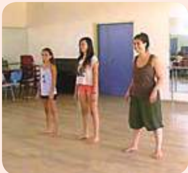
חזן במחנה הקיץ

הפיקו אותו המורות לאנגלית נעמי סטרום וניקול חזן והשתתפו בו 30 תל- מידות בנות 10-13 שעסקו בפעילויות שונות כמו יצירת אמנות, הכנת תכשי- טים, דרמה, ריקודי היפ הופ ועוד. והכול בשפה האנגלית! תודה לכפר שאירח אותנו, ולאנשים המקסימים שעזרו ליצור קיץ מושלם. נתראה בקיץ הבא.