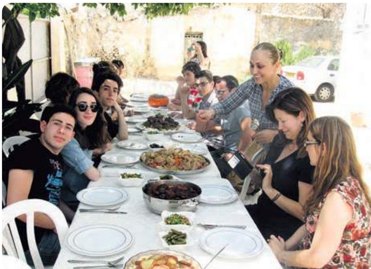
אוכלים ונהנים בבית משפחת אבולבן

זוכי הפרס השנה על תרומה לאנושות הם: הכלכלנית אסתר דופלו, שעוסקת בחקר שיטות כלכליות להתמודדות עם בעיית העוני במדינות עולם שלישי, הפילוסוף הצרפתי פרופ' מישל סרס, ליאון ויולטיר, מבכירי הקהילה היהודית בארצות הברית, הגוה, סופר ועורך העיתון The New Republic, ופרופסור סר ג'פרי לוי, שחקר את היסטוריית החברה והרעיונות היווניים.