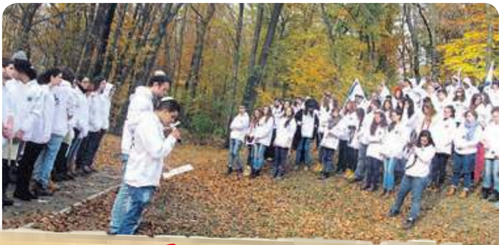
חברי המשלחת ביער הילדים, זביליטובסקה גורה