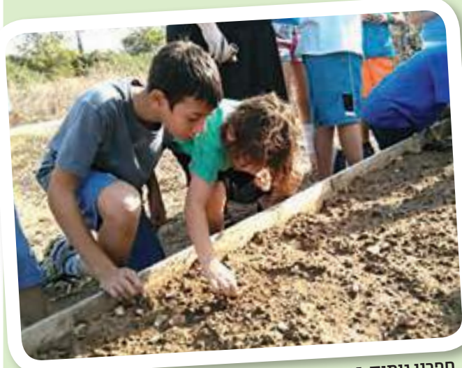
חפרנו גומות, זרענו זרעים. אירוח תלמידי ג'

מילדי כיתות ג'. איחלנו להם נסיעה טובה והתכנסנו ליד המורה. צליל סיכמה את החוויה שעברנו, מהתחלה - ועד הסוף. כשחזרנו לכיתה היינו מאוד עייפים אך גם מאוד מרוצים. אני ממליץ לכולם לעבור חוויה כזאת, היא גם לימודית וגם מהנה. זה היה השיעור שטח הכי טוב שהיה לנו