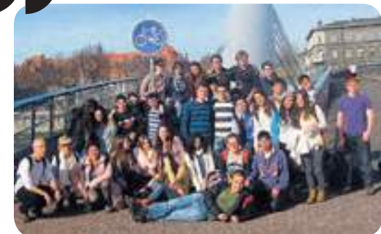
בקרוב ליד הוויסלה. כיתות י"ב

נסענו לעיירת הנופש קז'ימיש דולני. המעברים החדים היו קשים, כי המחשבות התרוצצו והשאלות נותרו פתוחות, אבל היה גם משחרר להרגיש שאפשר גם לאכול גלידה עם חברים