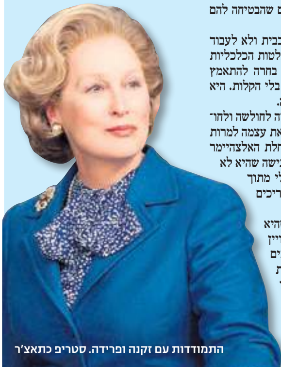
התמודדות עם זקנה ופרידה. סטריפ כתאצ'ר