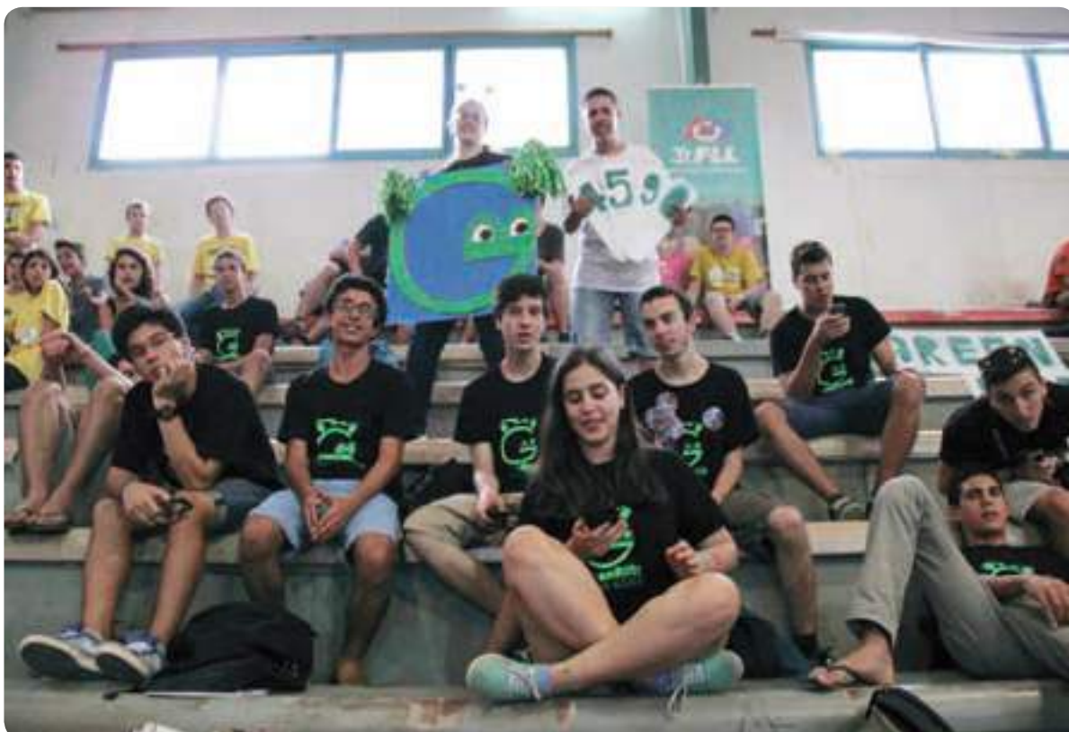
לתכנן את הרובוט לפי עקרונות אסטרטגיים. מגמת רובוטיקה