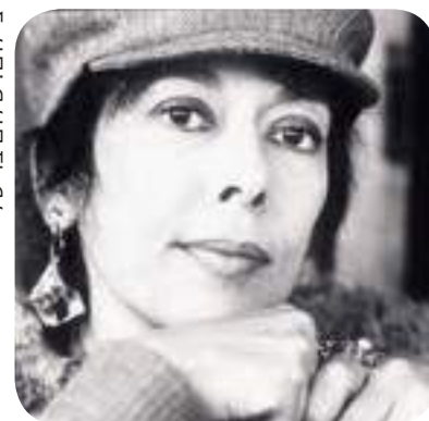
גיבורת תרבות. וולך