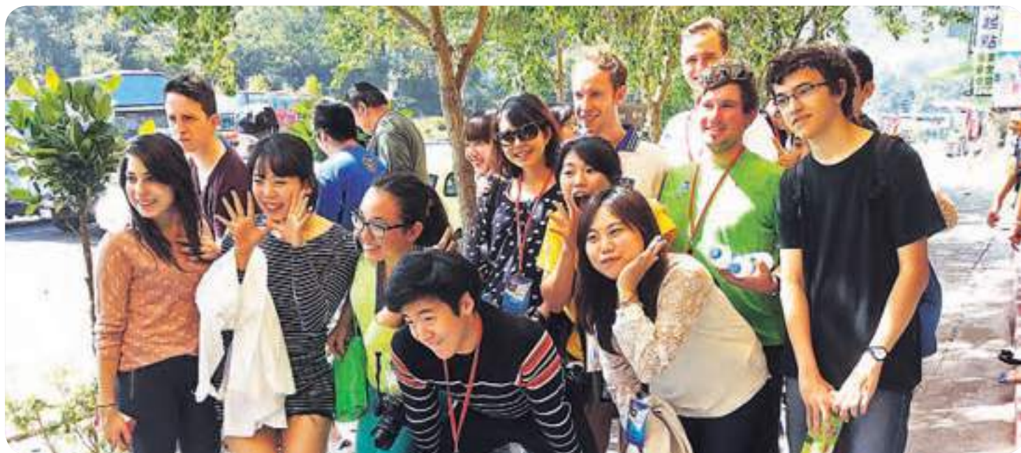
חוויות של מפגש. המשלחות הישראליות והטייוואניות