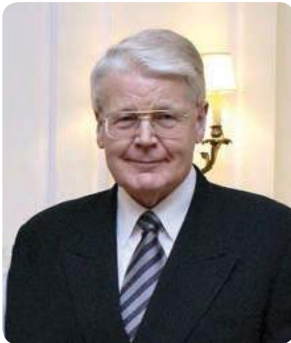
חולק את הידע עם אחרים. גרימסון

בזכות קשרים משפחתיים: נשיא איסלנד ביקר בכפר והרצה על אנרגיה ירוקה