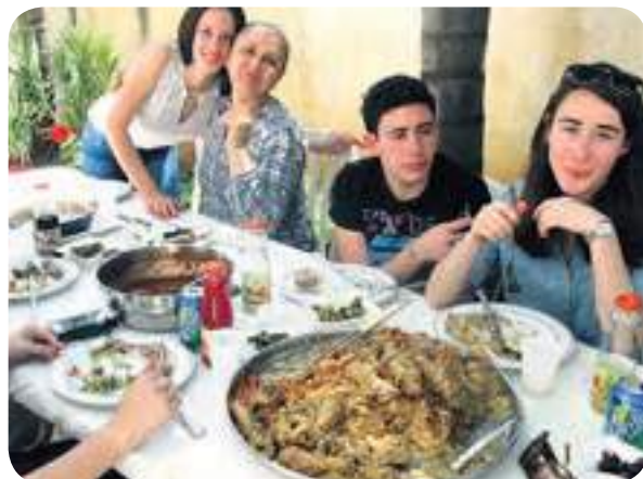
אירוח ונתינה נדירים

היה לנו פשוט בוקר נפלא. האירוח היה המשך גיבושון לקראת סוף השנה של כל תלמידי הכיתה והמורים וללא ספק נמשיך בפעילויות דומות כאלו ואחרות גם בי"ב.