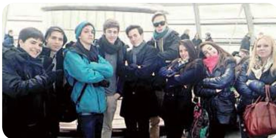
מסיירים בתל אביב. הישראלים והלייפציגים

חברינו מלייפציג גרמניה הגיעו לביקור גומלין שכולו חוויות, צחוק והנאה