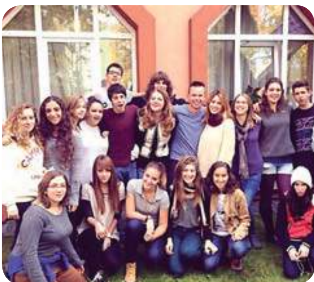
המשלחת לסמינר יאן קרסקי