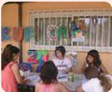
סטרום וילדי הקייטנה

במחנה הקיץ "speak up!" הכנו תכשיטים, רקדנו היפ הופ ויצרנו אמנות • הכל באנגלית!