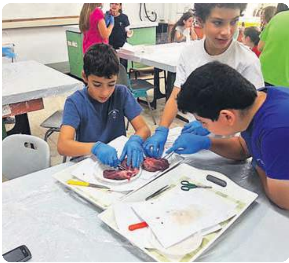
להבין בצורה מוחשית את מה שלמדנו. מנתחים