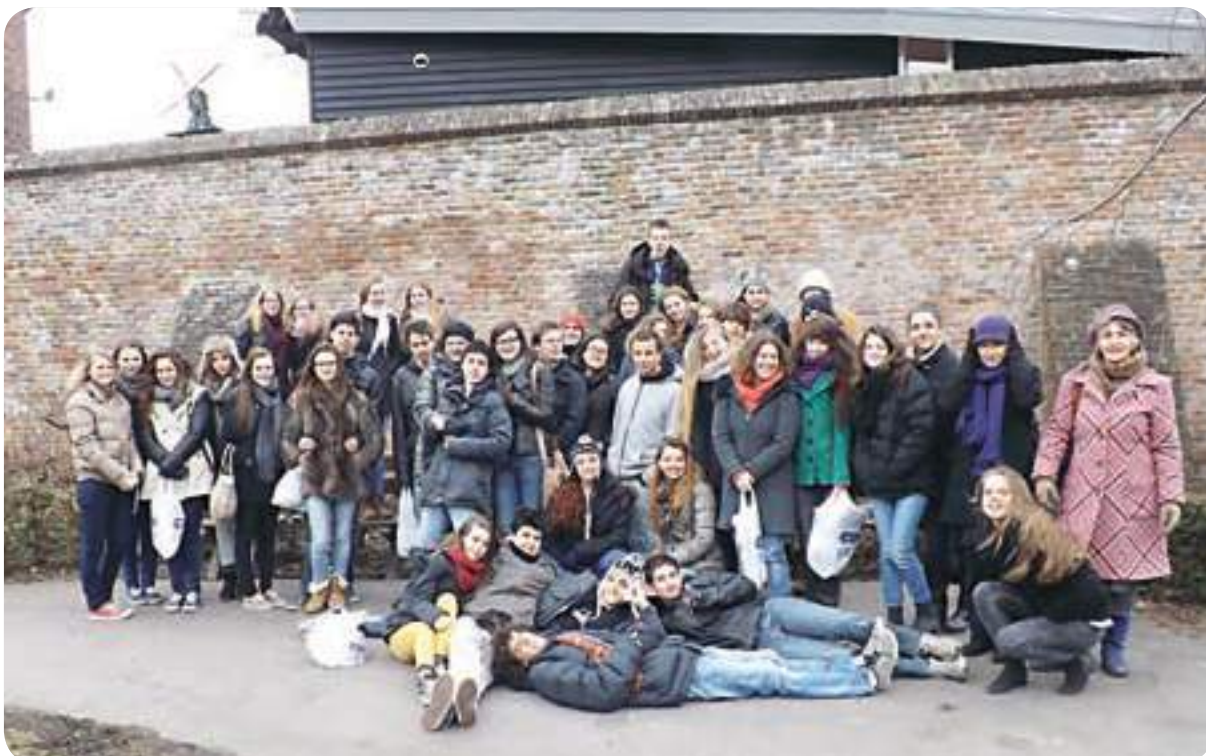
הכפריים מתארחים בהולנד. ניסיון של פעם בחיים

And the best part is that I got friends for life, people I can trust, people who know me and people I love. And it's not only