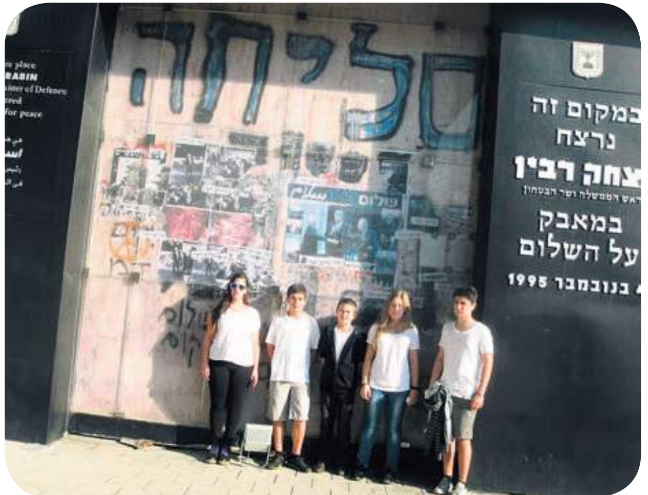
האם אנחנו יכולים להכיל את האחר? תלמידים באנדרטה לזכר רבין

יותר מאשר אירוע זיכרון לאדם חשוב שנרצח, טקס רבין הוא ההזדמנות שלנו כפרטים וכחברה להפנים את ערך הסובלנות לשונה מאיתנו