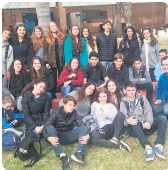
המכירות של המוצר יחלו ב-26.4 בקניון G בכפר-סבא. מובן שכולכם מוזמנים לבוא ולתמוך בפרויקט.