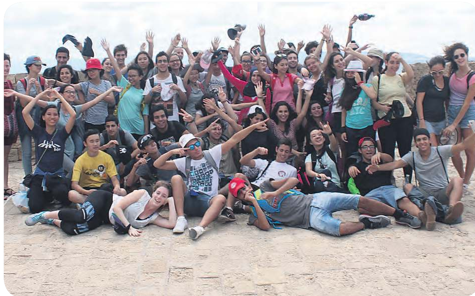
מגובשים מתמיד. תלמידי EMIS בטיוול

"יש קווי דמיון בין כל הילדים שבאים לכאן. הם לרוב מחפשים את המשפחתיות. תחילה הם מגיעים ביישנים, עם המון חלומות ורצון לפרוח, קצת כמו 'גולם' שטרם ביקע את מגנטותיו. ולבסוף הם יוצאים לאחר שנתיים של לימודים, נפוחי חזה ועם כנפיים פרוסות לרווחה, ואני רק