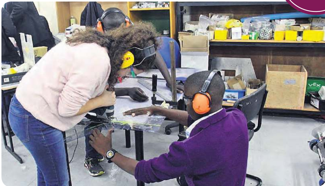
לימוד משותף. תלמידים מאוגנדה ומישראל במגמת רובוטיקה