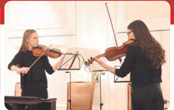
כיתת אמן עם הכנר הבינלאומי יוליאן ראלחין בעכו. המשלחת לגרמניה