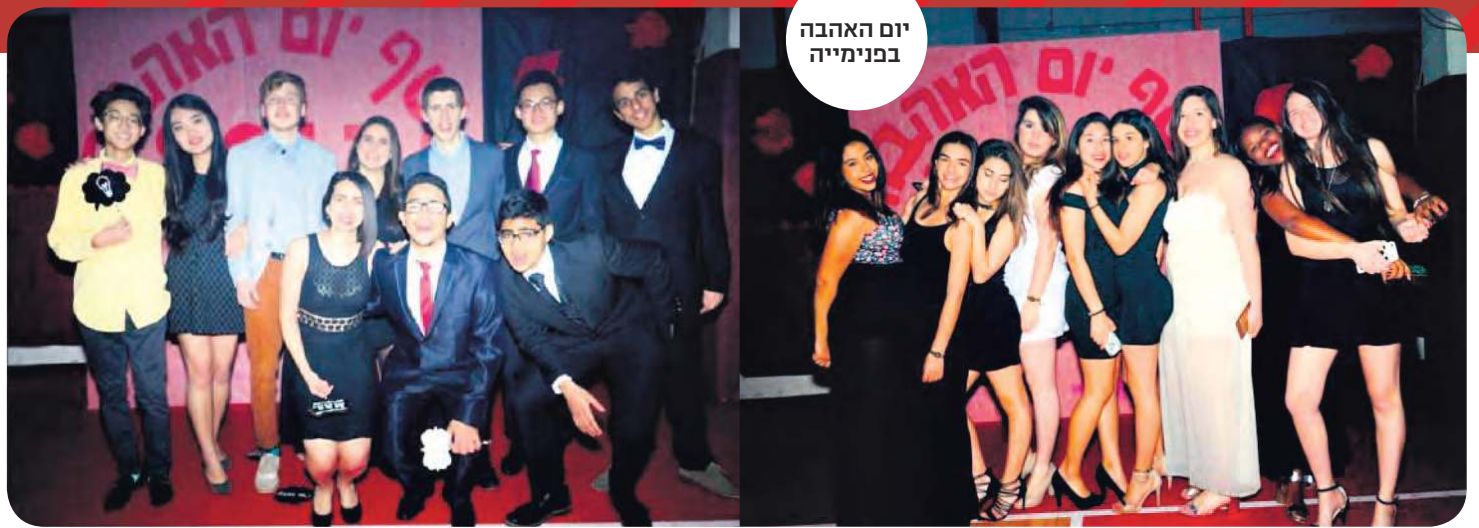
יום האהבה בפנימייה