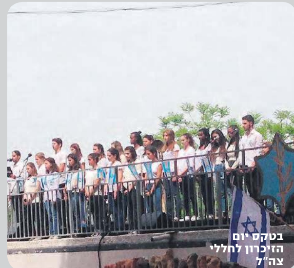
בטקס יום הזיכרון לחללי צה"ל