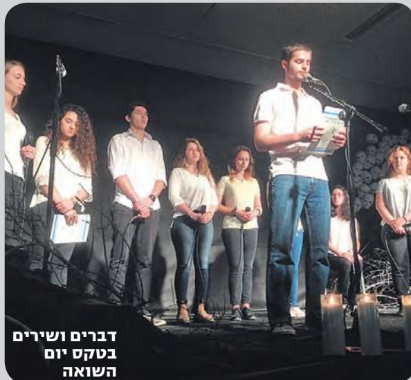
דברים ושירים בטקס יום השואה