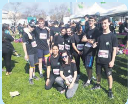
תלמידים ומורים במירוץ לחמש יחידות

הנפלאה והריצה עצמה - יצרו יחד חוויה בלתי נשכחת.