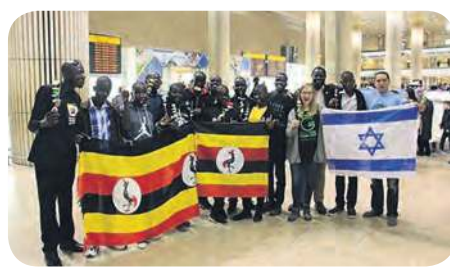
מקבלים את המשלחת מאוגנדה