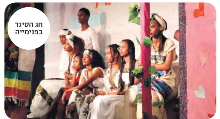
חג הסיגד בפנימייה

אבל הייתה לנו חוויה נפלאה וחדשה ביחד. אניה מקרנקו