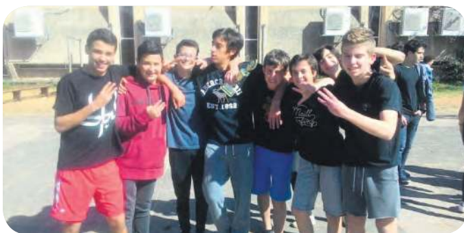
תלמידי ט'3 זכו במקום ראשון בטורניר כדורסל

כדורסל, מירוץ שדה וגם שחמט • אנחנו רציניים גם בספורט