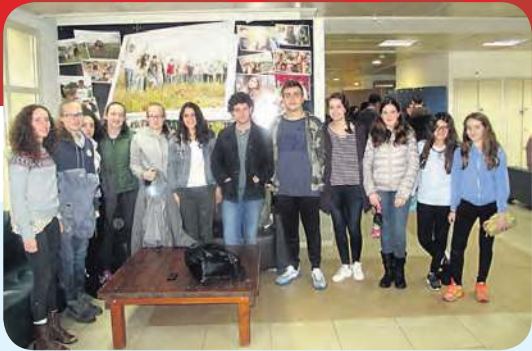
כתבי עיתון הכפר הירוק