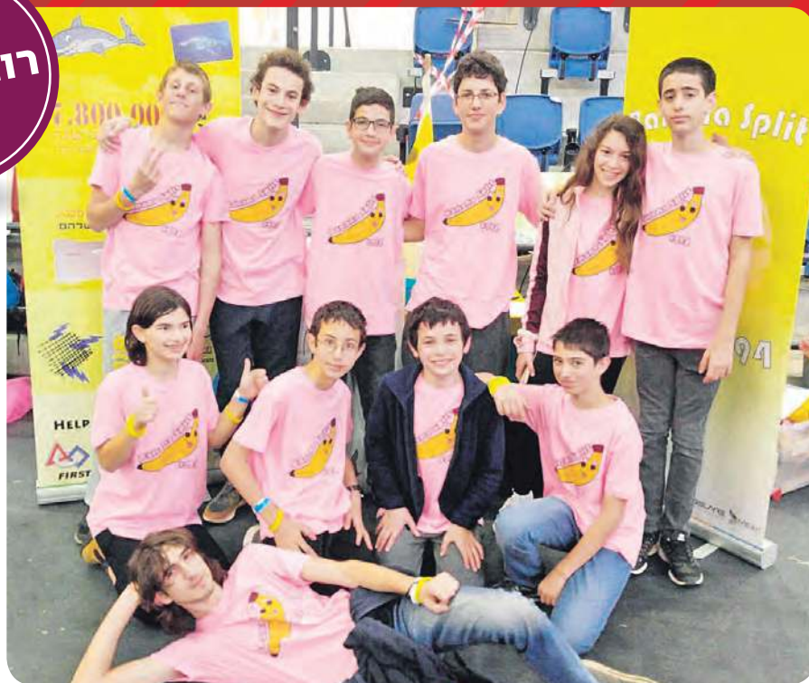
הזוכים בפרס השראה בפרויקט מניעת הכחדה של צבי ים. מגמת רובוטיקה