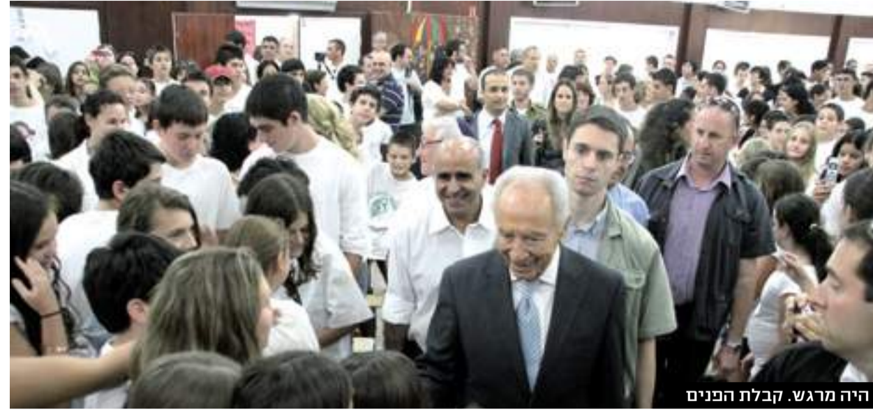
היה מרגש. קבלת הפנים