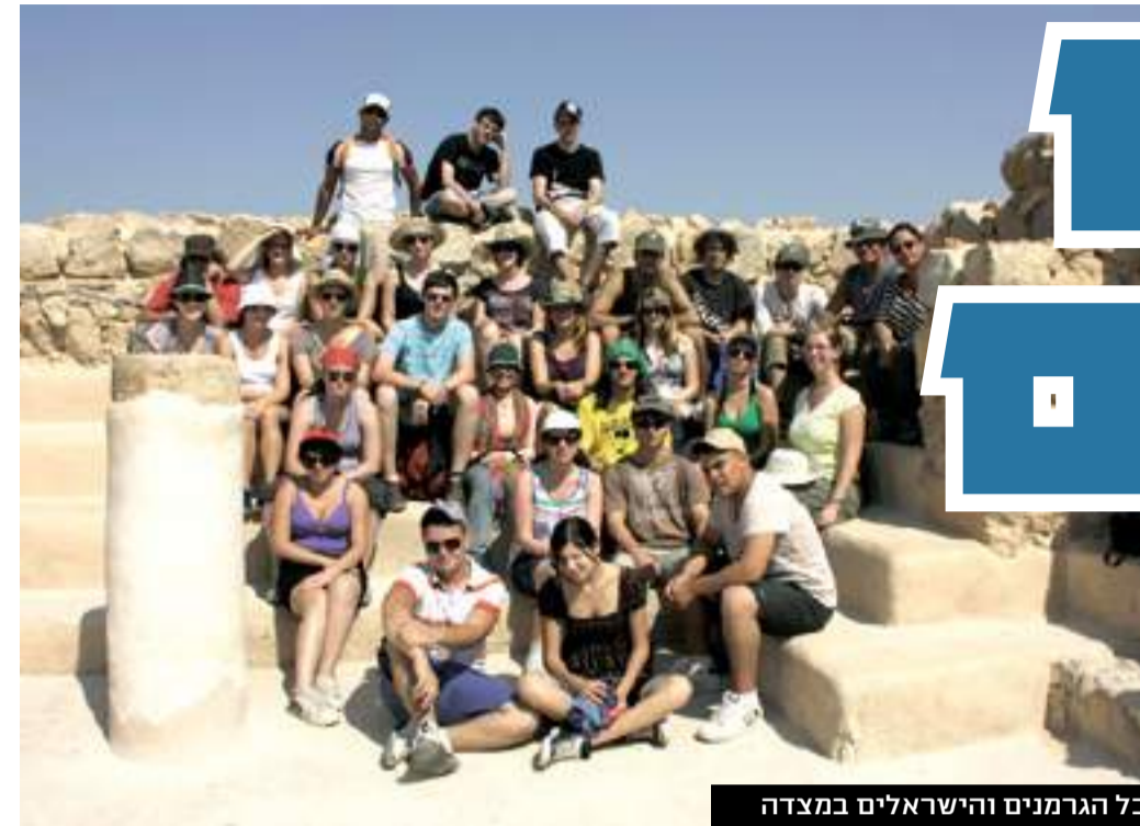
כל הגרמנים והישראלים במצדה

טיולים במצדה, בים המלח ובערים העתיקות ירושלים, עכו ויפו <<< סיור מיוחד ביד ושם <<< אירוח אצל המשפחות הישראליות וסתם חברויות שנוצרו, מוכיחים שהחיים חזקים מהכל <<< ביקור הגומלין של התלמידים הגרמנים בכפר הירוק היה מוצלח ביותר