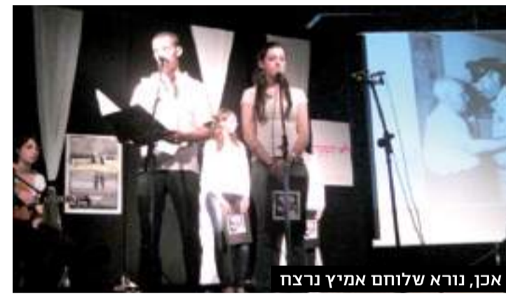
אכן, נורא שלוחם אמיץ נרצח

אחרי ששרד את כל מלחמות ישראל נרצח יצחק רבין כשהוא לא חמוש ולא מוגן, דווקא במלחמתו האמיצה למען השלום. ועוד על ידי אחד מבני עמו <<< דברים שנשאה עליזה בשור בטקס לציון 14 שנה לרצח