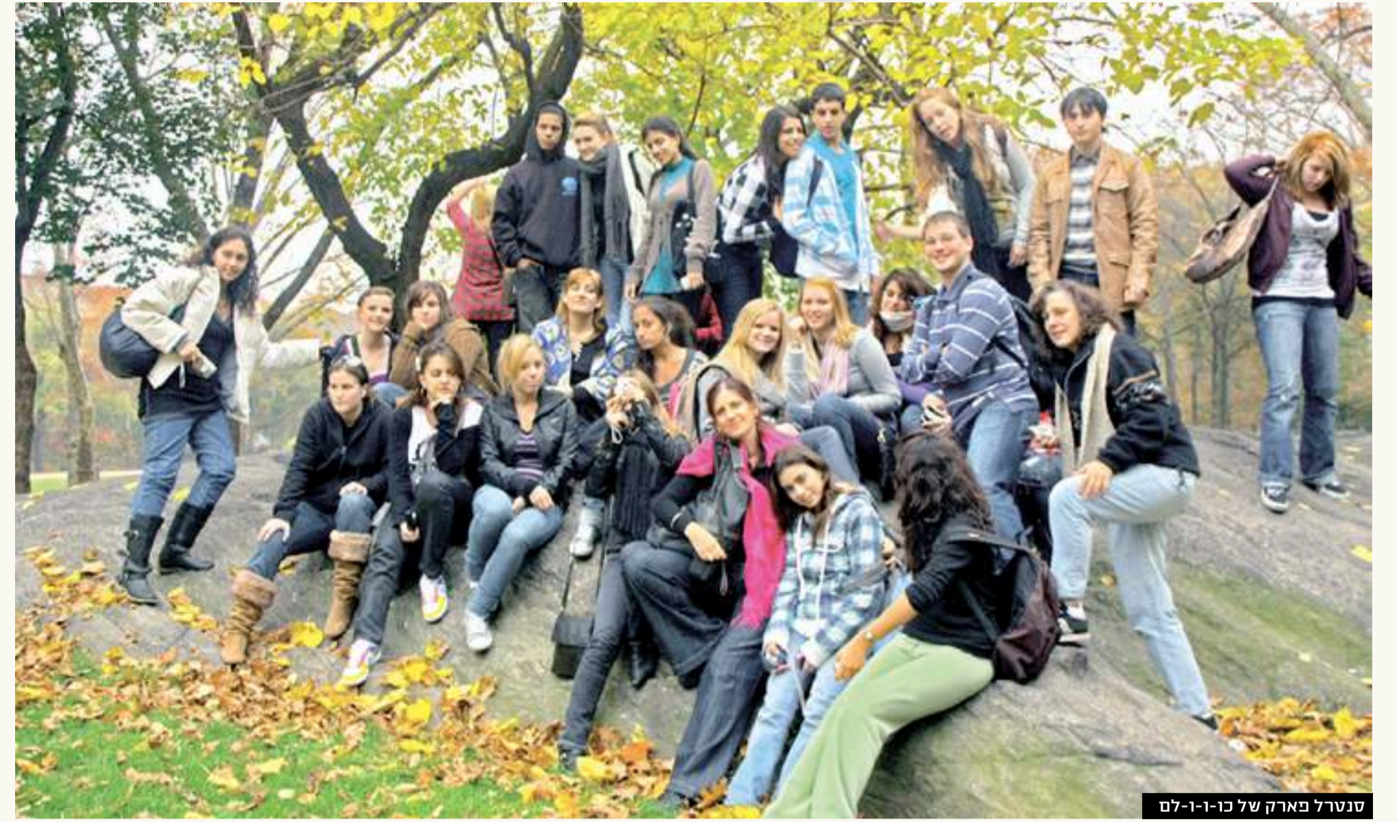
סנטרל פארק של ניו-יורק

משלחת מהכפר יצאה לביקור הסברה ייחודי בארצות הברית וחבריה הופתעו לגלות עד כמה מעט יודעים האמריקאים על ישראל (למשל, הפתעה הפתעה, שאנחנו מאזינים למוזיקה) <<< אחרי 17 ימים של כיף ועבודת שיגור, הם חזרו לארץ, ישראלים גאים