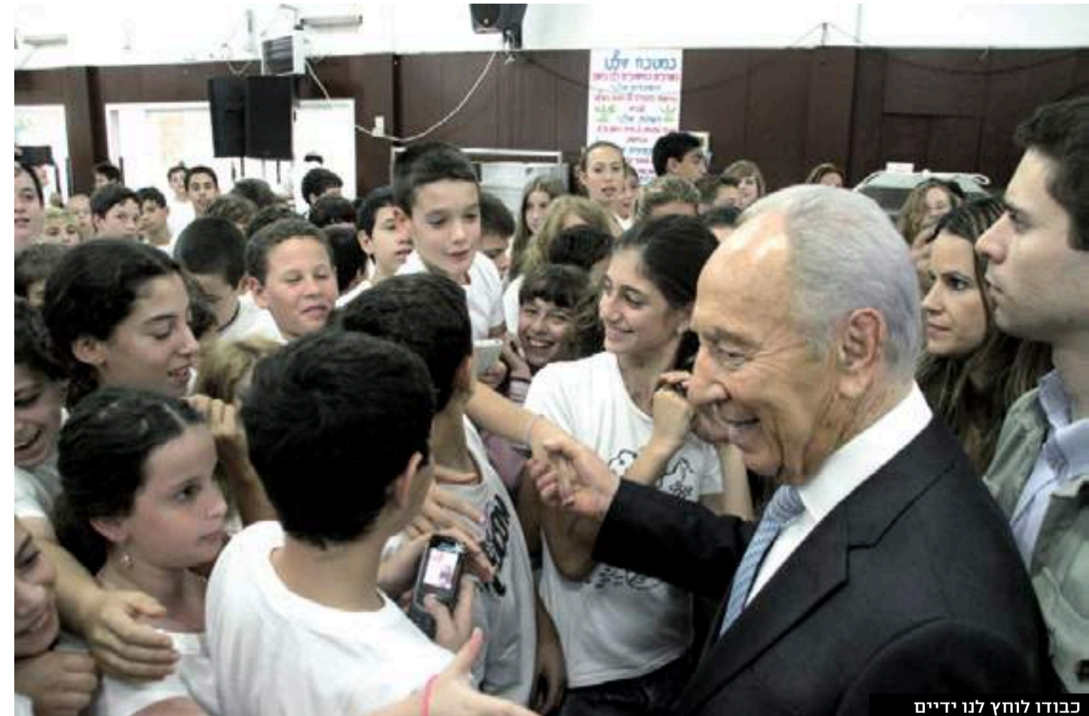
כבודו לוחץ לנו ידיים