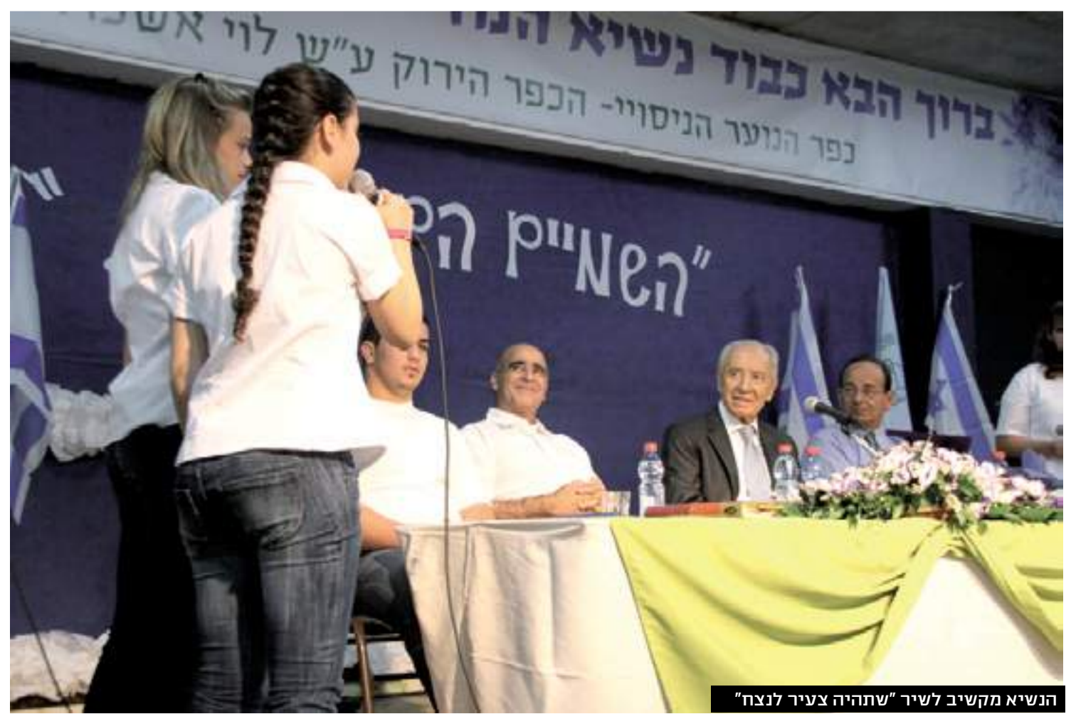
הנשיא מקשיב לשיר "שתהיה צעיר לנצח"