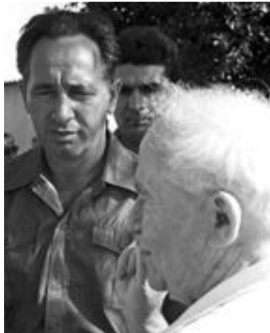
שנות החמישים. שר הביטחון דוד בן גוריון עם מנכ"ל משרדו, שמעון פרס

המנהיג המשפיע ביותר הוא בן גוריון, מפני שדחף להקמת המדינה ונתן דוגמה אישית כשעבר להתגורר בנגב