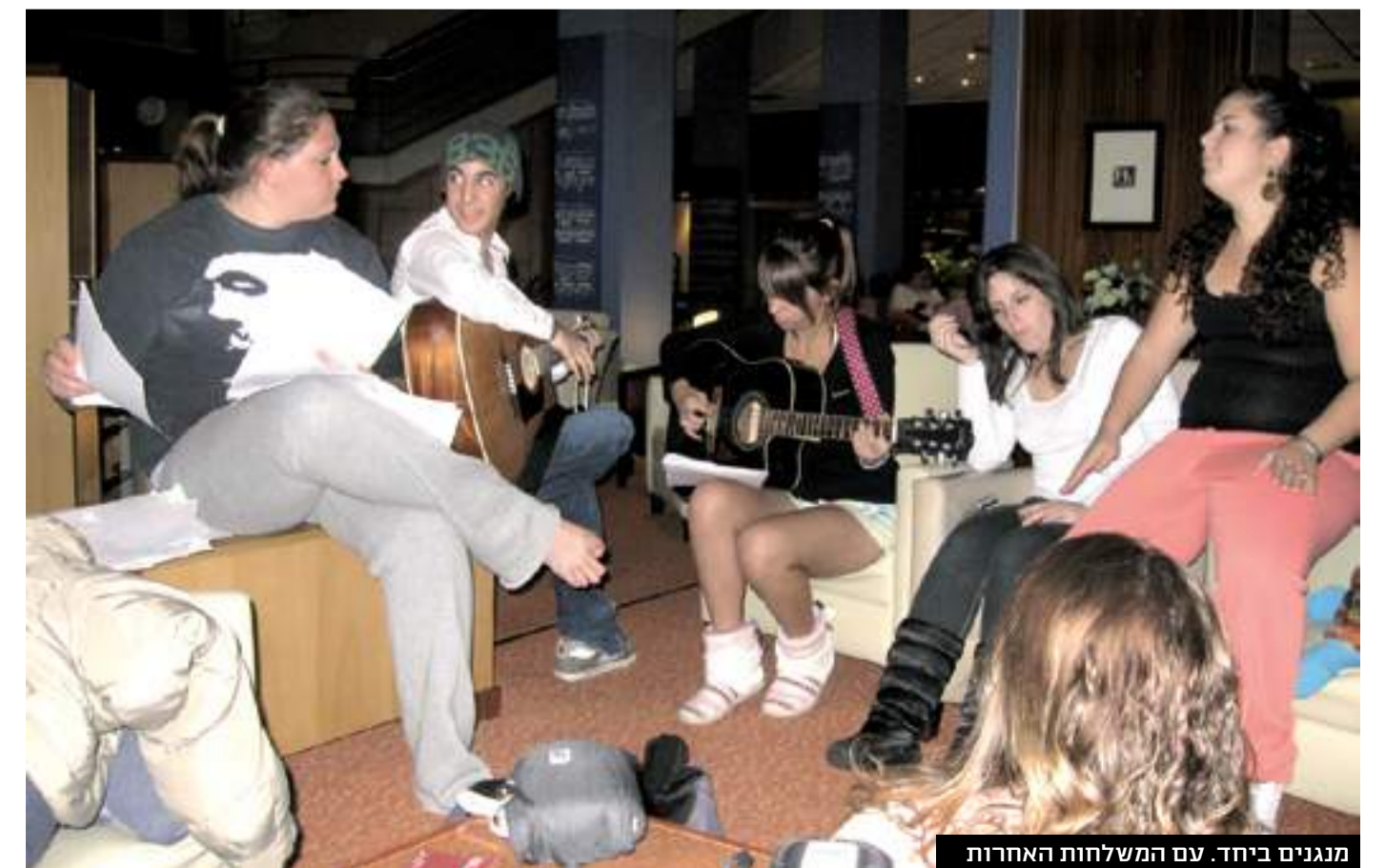
מנגנים ביחד. עם המשלחות האחרות