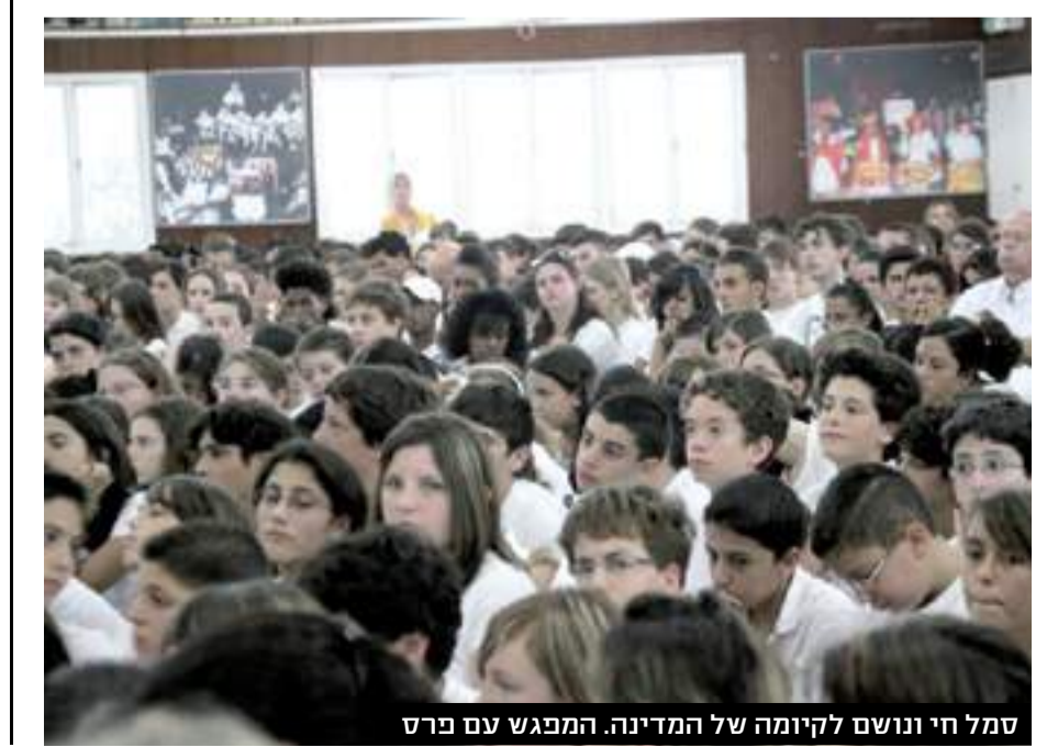
סמל חי ונושם לקיומה של המדינה. המפגש עם פרס