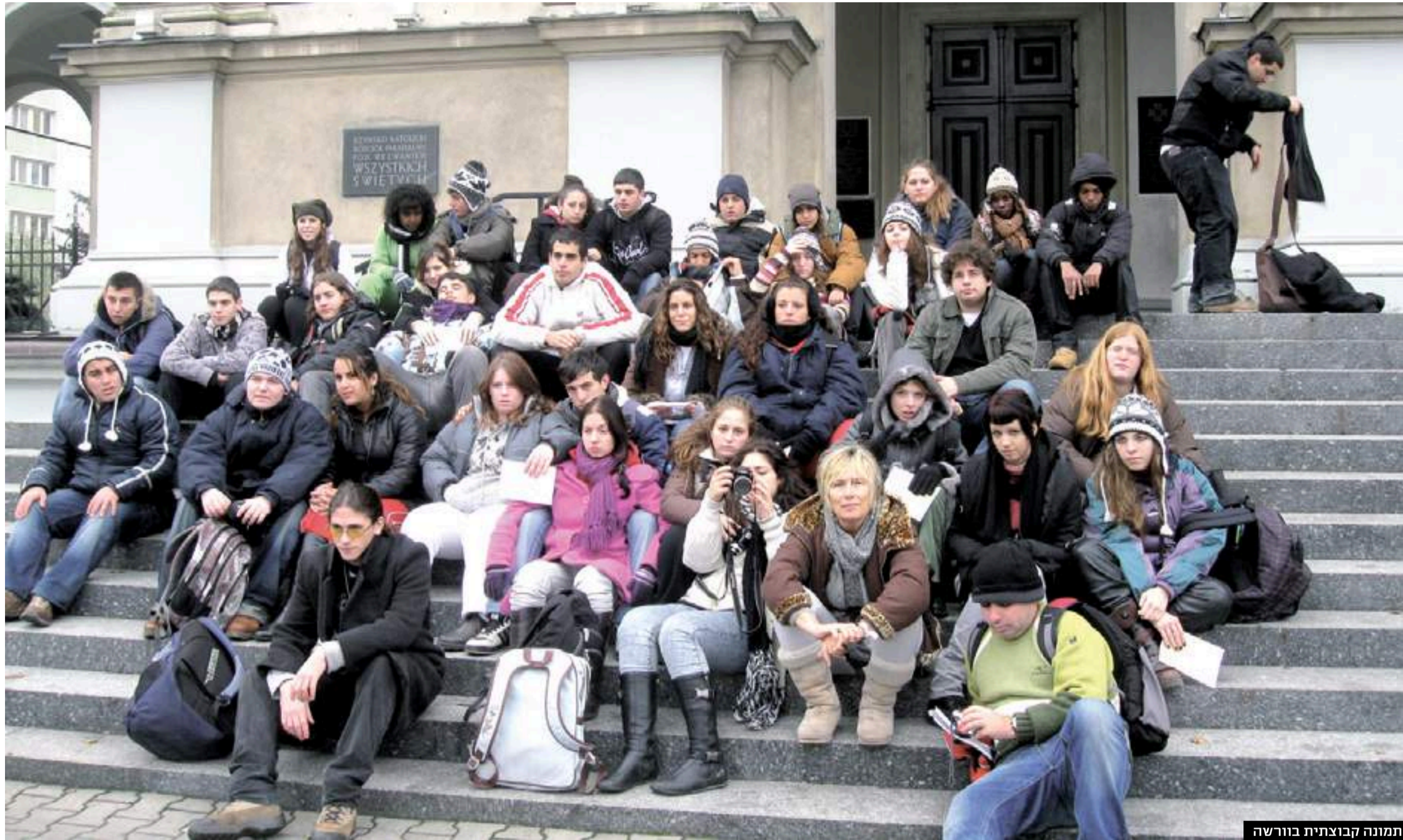
תמונה קבוצתית בוורשה