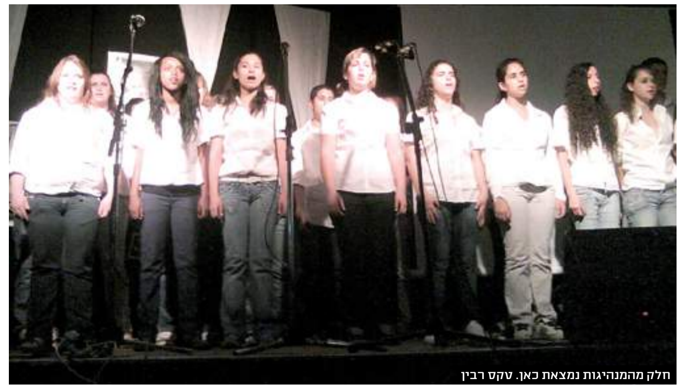
חלק מהמנהיגות נמצאת כאן. טקס רבין

מדינה דמוקרטית? מותר להתבטא? האם כך? שלב א' - אלימות מילולית. שלב ב' - הסתה. וכמו בתרשים זרימה יהיה גם מי