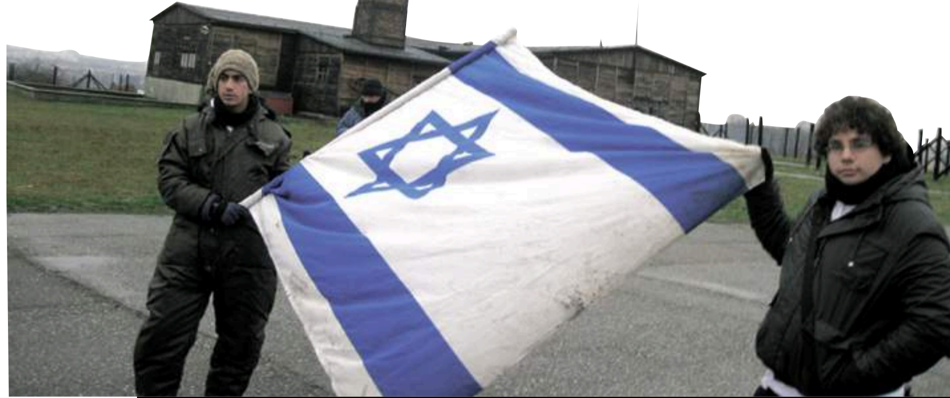
המסע לפולין מלא ניגודים: יום כיף בקרקוב ולמחרת ביקור מזעזע באושוויץ