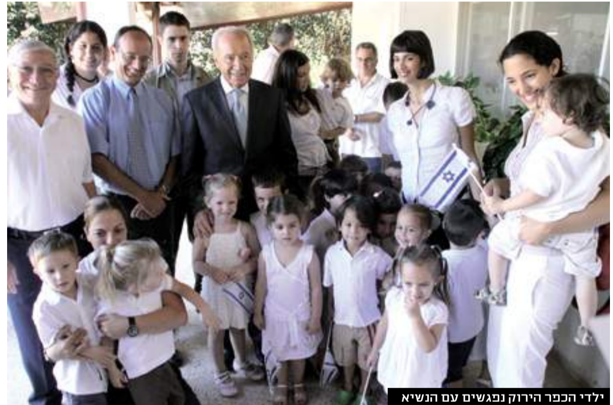
ילדי הכפר הירוק נפגשים עם הנשיא