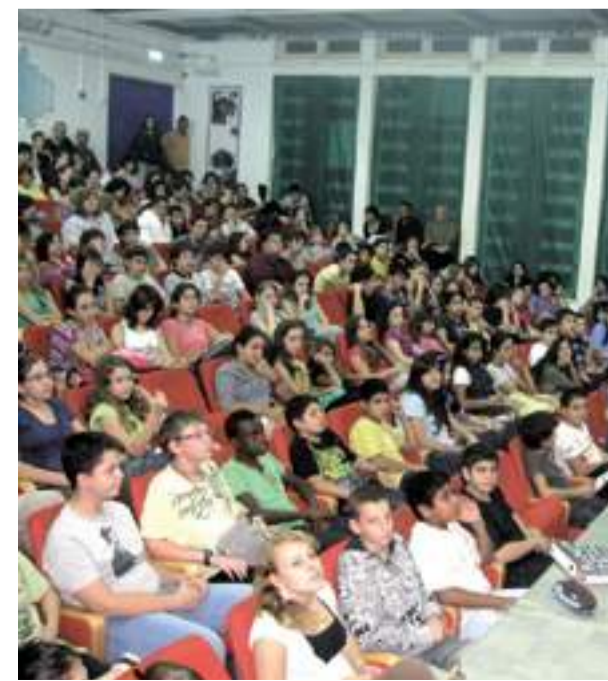
עברתי ב'לול. לחיאני

מה הלקחים העיקריים שלמדתי בכפר? "להיות שווה לכולם. לומר את המילה הטור במשחק על במה".