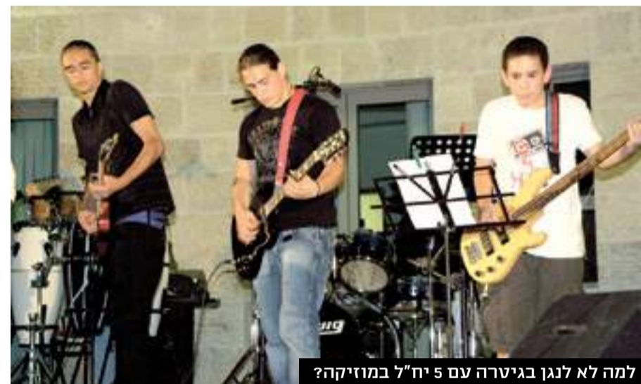
למה לא לנגן בגיטרה עם יח"ל במוזיקה?

פיזיקה קיימים שלושה מסלולים: 1. מסלול לתלמידים שמעולם לא למדו פיזיקה ומעוניינים לבחור בו כמקצוע הרחבה (אך ורק בתנאי שציונם במתמטיקה הוא לפחות 90, ברמה של 4-5 יח"ל). 2. מסלול מופת (שבו התלמידים ימשיכו את הלימוד ויבחרו להם 5 יח"ל). 3. מסלול אקדמי (לכיתת המחוננים). גם שם בסוף השנה יצטברו להם 5 יח"ל, אך הם יסיימו את לימודי הפיזיקה ב"א, בניגוד לשני המסלולים האחרים.