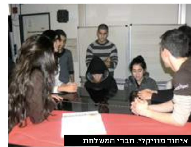
איחוד מוזיקלי. חברי המשלחת

הביקור היה הצלחה עצומה. בעצם, זאת היתה הפעם הראשונה, שבה נרשם שיתוף פעולה בין המשלחת השנונת בהעמדת מופע, ונוצרו קשרים לא רגילים בין חברי המשלחת. היה מרגש לראות ערבים ויהודים ישראלים, טייוואנים, גרמנים ואינדיאני אחד מארצות הברית - כולם על במה אחת, שרים ביחד ומרימים את הקהל המקומי, שעמד ומחה כפיים ולא