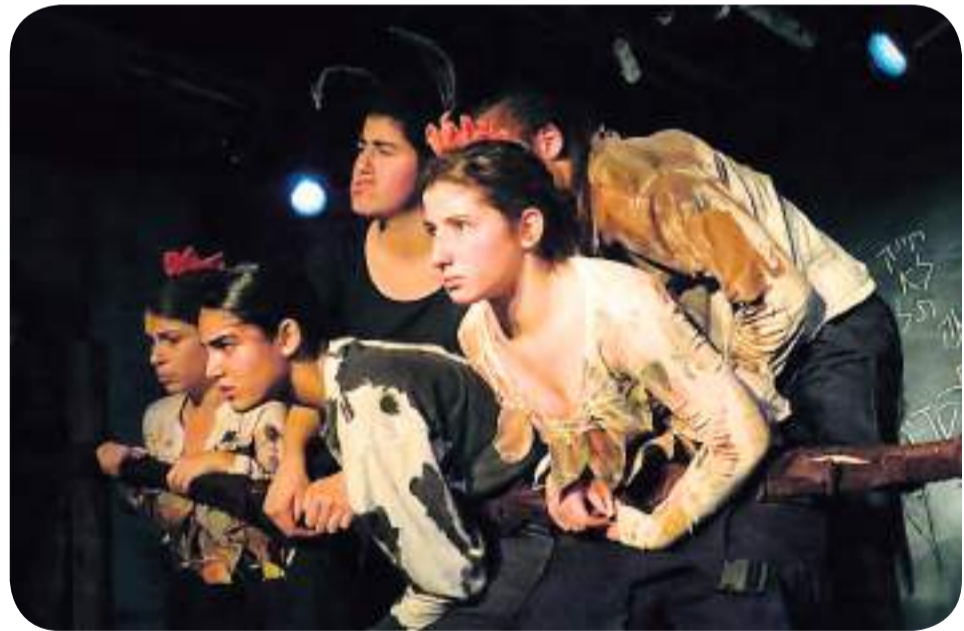
הפקות תיאטרון של מחזור ס"א

הייתי יודניקית, הכל קרץ לי כל כך והלהיב אותי. התייחסתי לריושקה כאל הבית שלי. שעות אחרי יום הלימודים הייתי נשארת בו, יושבת עם חברים, מנגנת, מתאמנת וחושבת. התחלתי להרגיש בבית. התחלתי להרגיש שייכת. מצאתי חברים חדשים, בני גילי, צעירים ומבוגרים ממני. בזכות הבניין הזה הבנתי מהו כוחה של מוזיקה. גיליתי את סודותיה היפים ביותר, אגרתי זיכרון נות בלתי נשכחים, הכרתי חברים לחיים, התפתחתי, פרחתי ופיתחתי אישיות ואופי משל עצמי. היום אני, אני בזכות הבניין הזה, בזכות הכפר מילות תודה לא תוכלנה להביע את הערכתי לכפר ולתהליך הבלתי ייאמן שעברתי בזכותו. שינוי של מאה שמונים מעלות, שינוי של בגרות, חוכמה, הבנה ואושר. קשה להאמין שהגיעה שעת