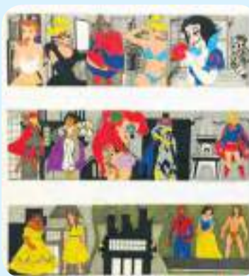
לקט יצירות מתוך תערוכת הגמר של מחזור ס"א