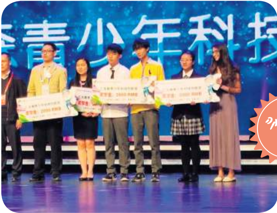
תלמידים בתחרות בסין

ביותר שם. המפגש היה מרתק. המנהל וצוות המורים ביקשו לשמוע על מערכת החינוך בארץ ועל הלימודים בכפר הירוק והביעו נכונות רבה לקיים מפגשים וחילופי נוער בעתיד.