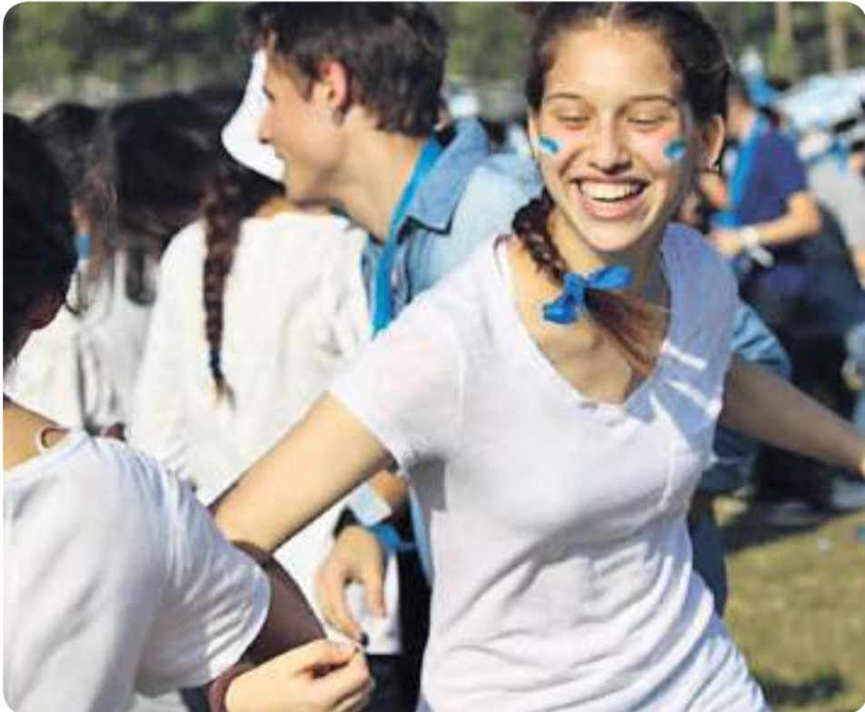
צוהלים ושמחים בכ"ט בנובמבר

איפה הוכרזה המדינה ומי איפשר זאת? איפה חי ביאליק המשורר הלאומי, ומי הם מייסדי תל אביב? מה זה קיבוץ? ואיך הוא קשור לזהות שלנו כישראלים? • על שאלות אלה ועוד אנו מקבלים תשובות לאורך השנה, בשיעורי אזרחות ובספורים מרתקים