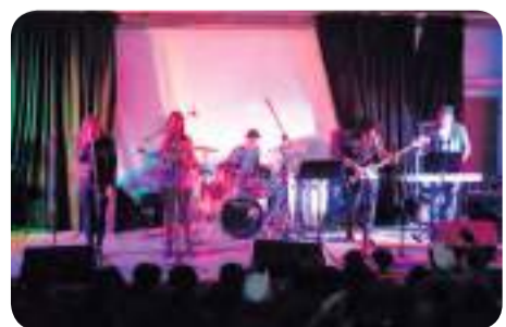
מגמת מוזיקה בשבוע אמנויות

עבוד תלמידי מגמת תיאטרון שבוע האמנויות הוא אחד מנקודות השיא. המגמה פועלת בשתי חזיתות: הן בה-צגת ערב הביכורים של שכבה י', והן בהעברת שיעורים פרונטליים לשכבות השונות. לכן, התחלקנו חברי השכבה הבוגרת של המגמה ואנו - שכבה י"א - לקבוצות. התבקשנו ליצור מערך הדרכה בנושא חנוך לויין, שאותו ניישם בכיתות. בשל העובדה שנושא שבוע האמנויות עסק השנה באמנים ישראלים הבחירה היתה מתבקשת.