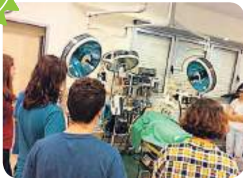
תלמידי י'3 בבית החולים מאיר