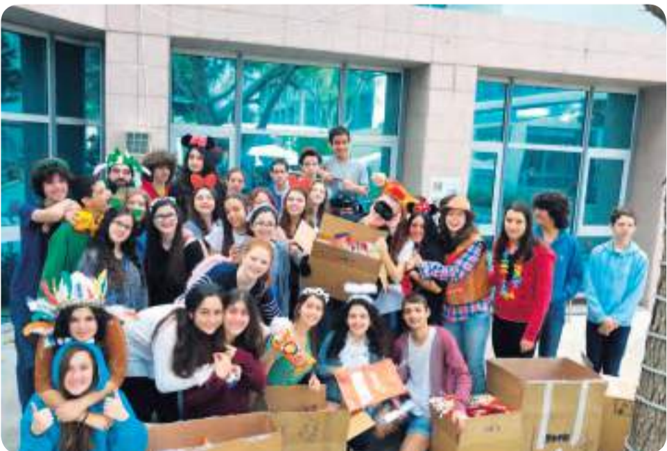
ט' 5 ביום המעשים הטובים