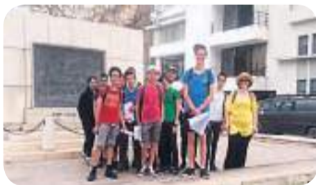
על יד אנדרטת המייסדים בשדרות רוטשילד

שהיה בעבר ביתו של מאיר דיזנגוף, ראש העיר הראשון של תל אביב, כמוזיאון "ההגנה" ובמגדל שלום (היכן שעמדה פעם הגימנסיה הרצליה). הטיוול העשיר את הידע שלנו, ובזכותו יכולנו להבין הרבה יותר טוב את ההיסטוריה הרחבה של תל אביב. בשכונת אחוזת בית, ראינו את הבתים הראשונים שהוקמו בעיר תל אביב על ידי שישים ושש משפחות המייסדים שלכבודן הוקמה "אנדרטת המייסדים", שראינו לאחר מכן. לאחר מכן הלכנו לבית העצמאות, שכיום משמש כמוזיאון, אך בשנת 1948 דוד בן-גוריון ראש הממשלה הראשון של מדינת ישראל, הכריז בו על הקמת המדינה. ראינו כי באותו החדר שבו הוכרזה המדינה, נשאר עד היום השולחן,