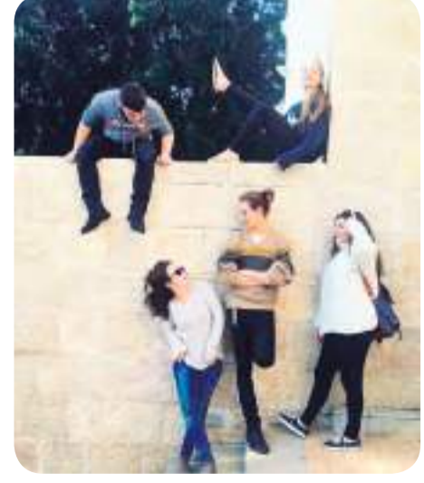
מגמת מוזיקה של מחזור ס"א

קשה להאמין שהגיעה שעת לעזוב. רק לפני שנתיים וחצי הגעתי הנה, אחוות פחה, חשש ואיבודאות. הגעתי למקום חדש, עם כמה חברות בודדות ונדרשתי לבנות לעצמי מעגלים חברתיים מאפס, להתברג במערכת וזה ולא לאבד את הדעת. לא היה לי מושג שההתאקלמות תהיה קצרה וקלה כל כך. אחד המקומות שבזכותם הצלחתי לפרוץ, הוא בית ריושקה. הגעתי לריושקה בתקווה שאחרי כמה שיעורים אפרוש ממגמת המוזיקה ולא תיארתי לי שההפך הוא הנכון. התאהבתי. התאהבתי באנשים, במקום, בבניין, באווירה, במוזיקה.