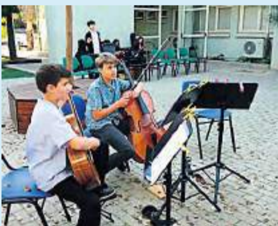
תלמידי מגמת מוזיקה קלאסית מנגנים

בסוף פברואר התקיים יום חשיפת מגמות ואשכולות לימוד לתלמידים שלנו העולים לכיתה י'. ההורים והתלמידים הוזמנו לעבור בין המגמות השונות בכיתות ובכניין של כל מגמה ופגשו שם את צוות מורי המגמה. אנו מאמינים כי בחירה נכונה ומתאימה של מגמה תהפוך את הלימודים לחווייתיים יותר. התלמידים וההורים נחשפו למגוון המסלולים והמגמות שיש בבית הספר. תודה לצוות שכבת ט' על הארגון וההשקעה.