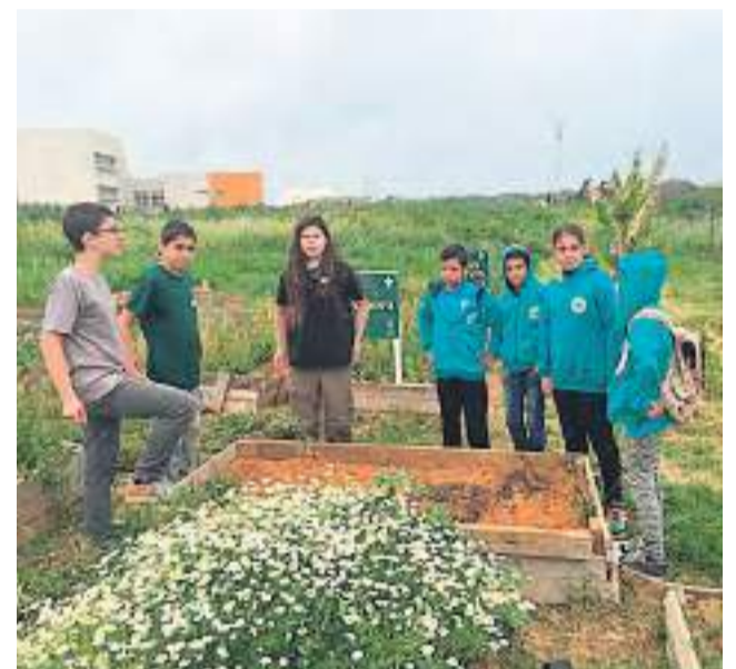
ביקור תלמידי קלנסוואה בכפר בעבודה עם תלמידי הכפר הירוק