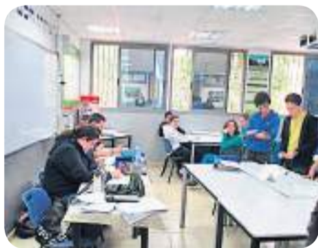
תלמידי ט'1/1 בסימולציה על הסכם ורסאי

משחק תפקידים שימש לכיתה ט'1/1 הזדמנות להבין לעומק את האינטרסים של המדינות שהשתתפו בוועידת ורסאי, שהתכנסה בסיום מלחמת העולם הראשונה • היה מרתק