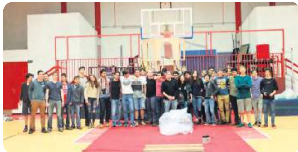
מגמת רבוטיקה תשע"ו

חברי קבוצת הרבוטיקה מתנדבים במקומות שונים כדי לעניין ולקדם ילדים שאינם מכירים את התחום