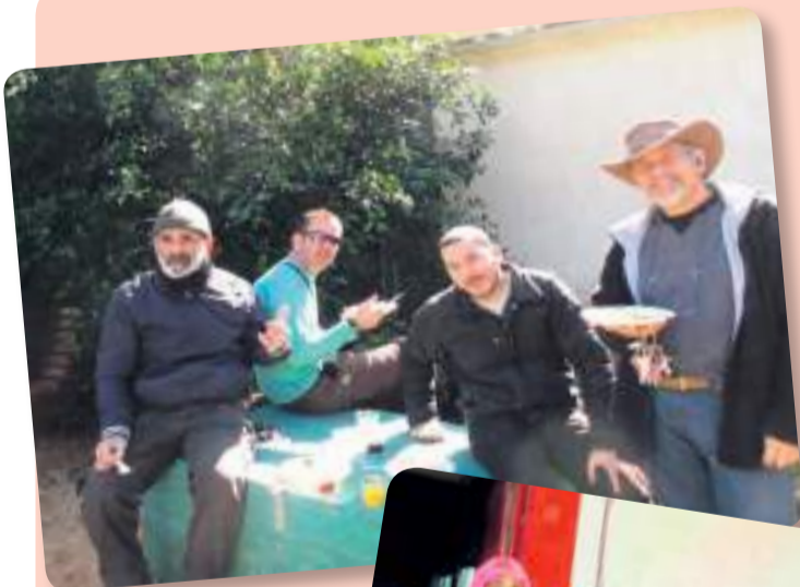
מורי החטיבה והתיכון בחג פורים

ט"ו בשבט וסיום מחצית. פירות יבשים ונהנים