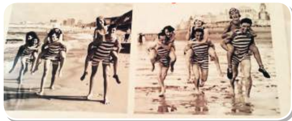
י"א/2 בשחזור של תמונות היסטוריות. אז והיום