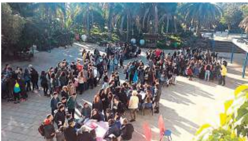
מגמת מחשבת בדיונים על שאלות חשובות בחברה הישראלית

אפליה בתקצוב החינוך היהודי מול החינוך הערבי? יחס החברה לניצולי שואה? הצגת נשים בתקשורת? • אין נושא שחומק מדיון מעמיק במגמת מדעי החברה