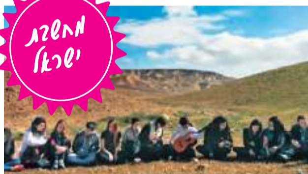
מגמת מחשבת בסיור במדבר