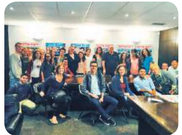
כתבי ידיעות הכפר יחד עם תלמידי אמיס בביקור במערכת ידיעות אחרונות בחדר העורך רון ירון

עיתונאים לא יכולים לחזות מה עתיד להתרחש ולכן יכולים למצוא עצמם עובדים על אירוע שנראה כבעל משמעות עמוקה כאשר חמש דקות אחר כך האירוע כבר לא רלוונטי