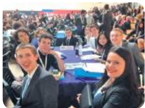
אמיס משתתפים במודל האו"ם

כל זאת, נעשה במטרה להכין אותנו לסימולציות פנימיות של ועדות האו"ם במועדון עצמו, או