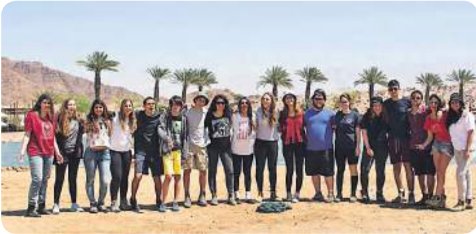
מגמת קולנוע של מחזור ס"א

בצפייה בסרטים מיוחדים, אך בעיקר ביצירה – משהו שלי.