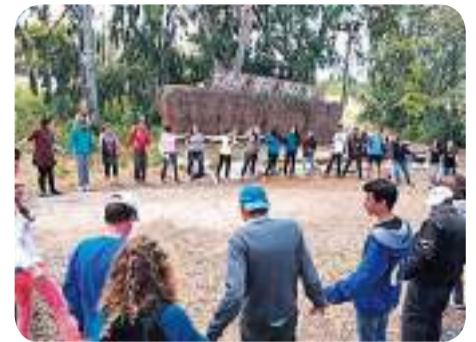
7/7 מפעילה את תלמידי כפר עופרים

אחראים על ערכי תרבות, עושים הכול באהבה ורגישים להיסטוריה • תלמידי הפנימייה מובילים את ערכי הכפר הירוק ותורמים לחיי החברה