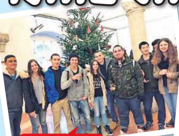
משלחת לאוסטריה שכבה י"א