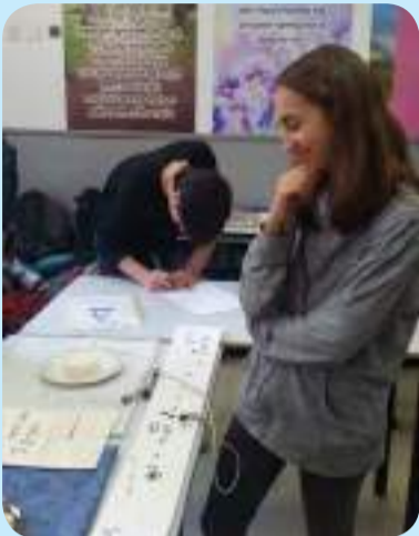
יריד עבודות בספרות ט'7