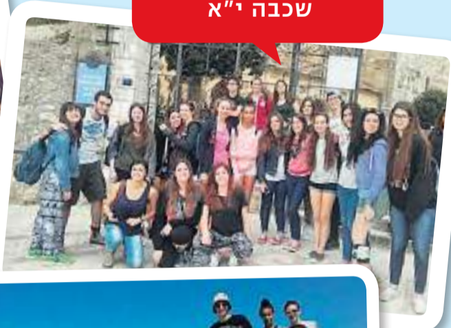
משלחת לאיטליה שכבה י"א