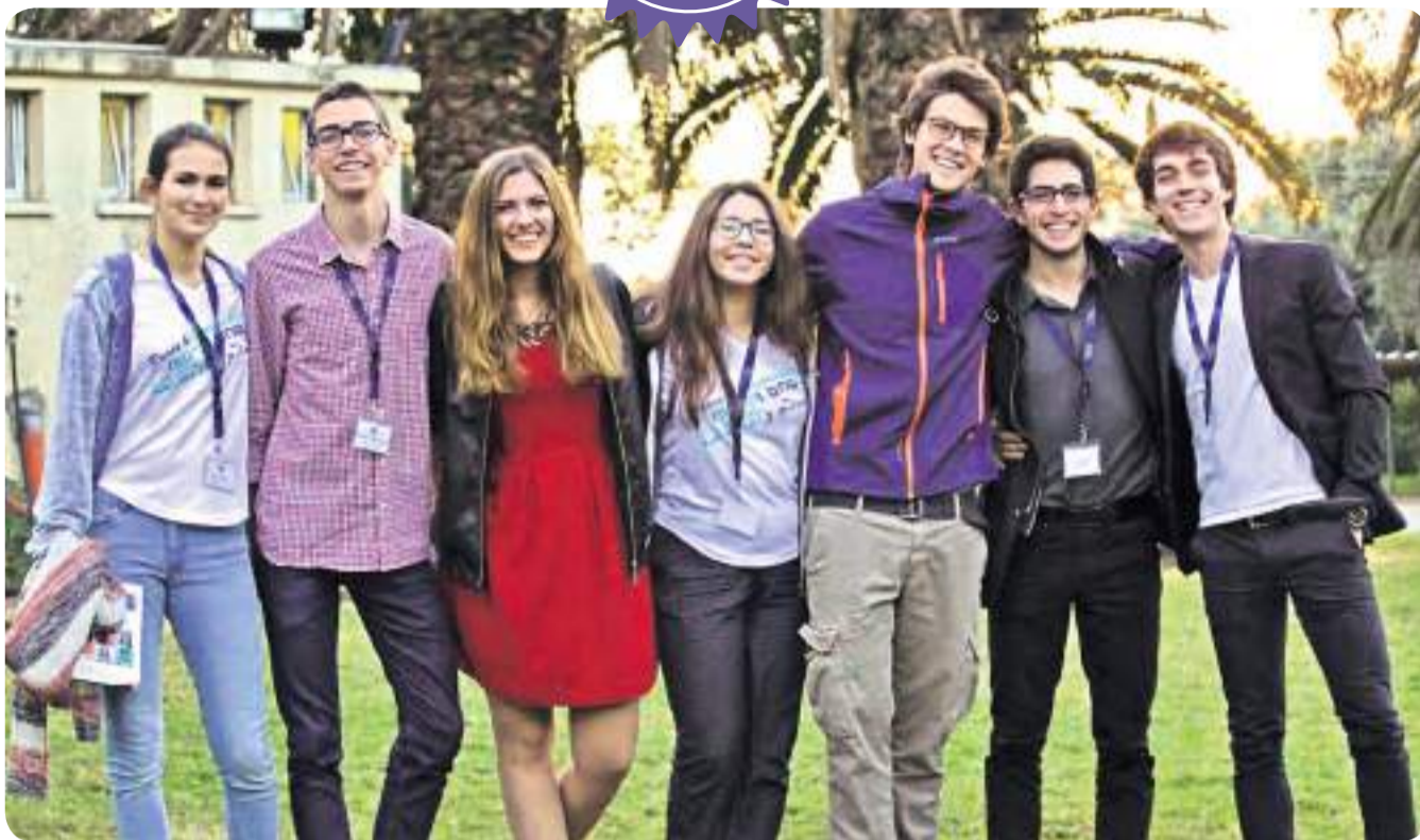
ביקור אמיס בבית הספר האמריקאי באבן יהודה