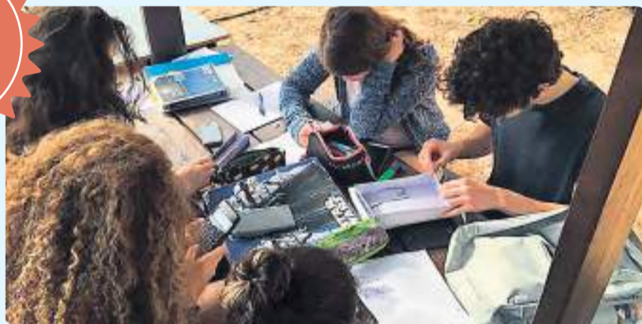
תלמידי כיתה י' בשיעור גאומטריה

בעיר וולר כל האנשים גנבים. הרשויות יכרי-לות לפקח רק על דברים הנשלחים בתוך ארגז נעול עם מנעול. הם גונבים כל דבר שלא נעול. רועי, הגר בכפר הירוק, רוצה לשלוח לדניאל שגר בעיירת וולר סכום כסף. לכל אחד כמות ארגזים ומנעולים בלתי מוגבלת מהסוג הישן (לכל אחד יש את המנעול והמפתח שלו). אין להם מפתחות של המנעולים שלא ברשותם (הגנבים הם גנבים חכמים ואי אפשר לעבוד עליהם כמו למשל להחביא מפתח מתחת לארגז). אם ישלחו מפתח במעטפה הוא ייגנב. אם ישלחו ארגז עם מפתח ייגנב המפתח. האם גם אתם תוכלו להתחכם ולמצוא שיטה שבה רועי יעביר כסף לדניאל מבלי שהגנבים יגנבו אותו?