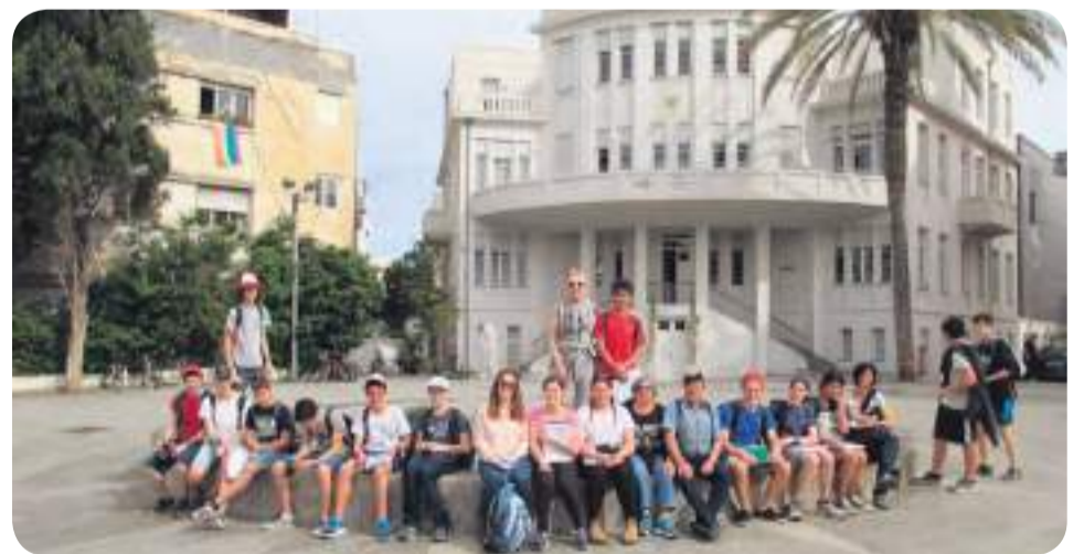
תלמידי ט'1 והוריהם ברחוב ביאליק על יד בית העירייה הישן

שהיה בעבר ביתו של מאיר דיזנגוף, ראש העיר הראשון של תל אביב, כמוזיאון "ההגנה" ובמגדל שלום (היכן שעמדה פעם הגימנסיה הרצליה). הטיוול העשיר את הידע שלנו, ובזכותו יכולנו להבין הרבה יותר טוב את ההיסטוריה הרחבה של תל אביב. בשכונת אחוזת בית, ראינו את הבתים הראשונים שהוקמו בעיר תל אביב על ידי שישים ושש משפחות המייסדים שלכבודן הוקמה "אנדרטת המייסדים", שראינו לאחר מכן. לאחר מכן הלכנו לבית העצמאות, שכיום משמש כמוזיאון, אך בשנת 1948 דוד בן-גוריון ראש הממשלה הראשון של מדינת ישראל, הכריז בו על הקמת המדינה. ראינו כי באותו החדר שבו הוכרזה המדינה, נשאר עד היום השולחן,