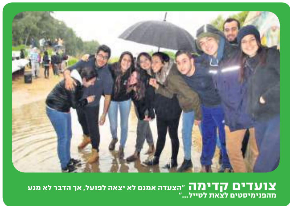
צועדים קדימה "הצעדה אמנם לא יצאה לפועל, אך הדבר לא מנע מהפנימיסטים לצאת לטייל..."