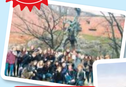
משלחת לגרמניה שכבה י"א