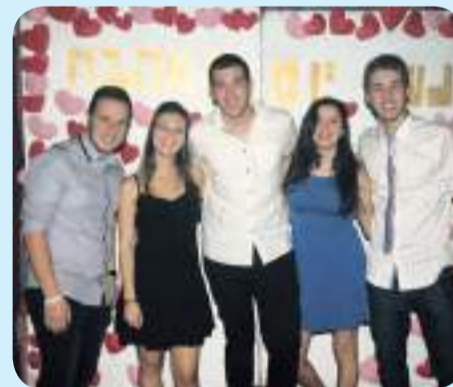
תלמידי הפנימייה ביום האהבה